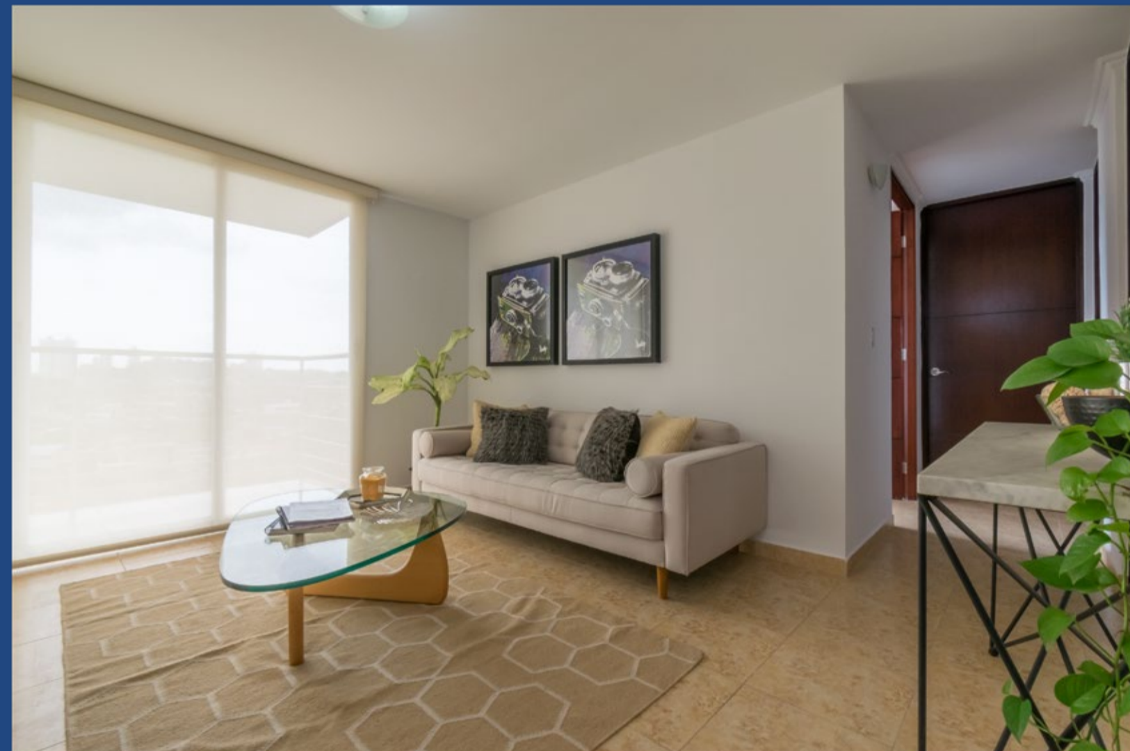
MODELO B. 95.31 MT2