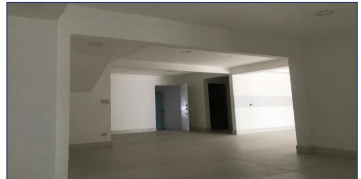
Otra vista planta baja.