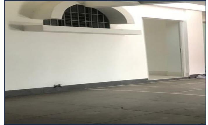
Vista entrada Cochera.