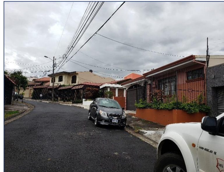
Otra vista del entorno inmediato.