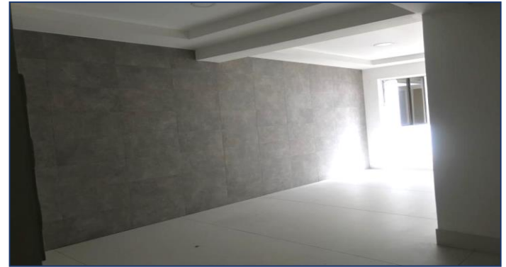
Vista planta baja