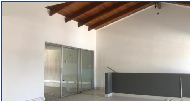
Vista segunda planta