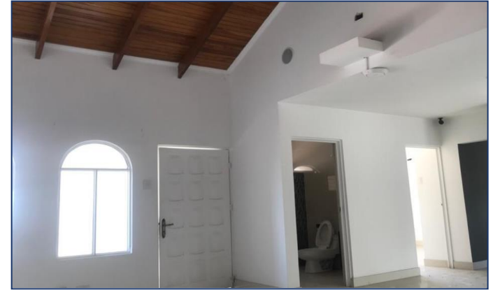
Vista espacios planta alta.