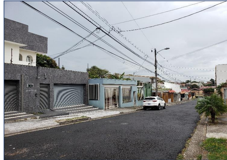
Vista del entorno inmediato.