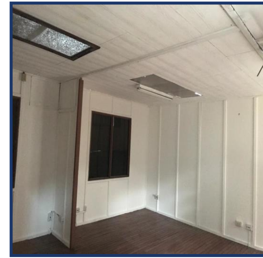
Vista interior de oficinas