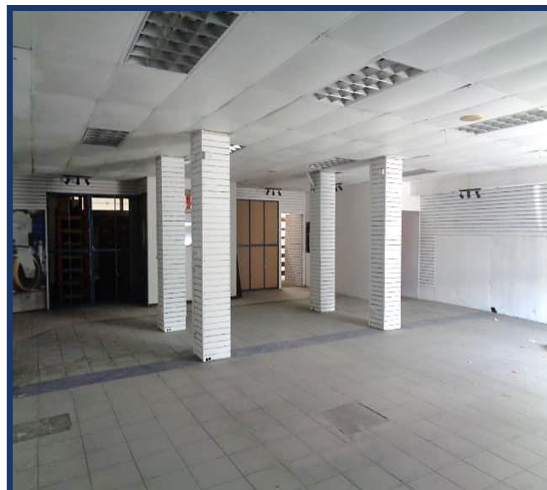
Vista local, área comercial