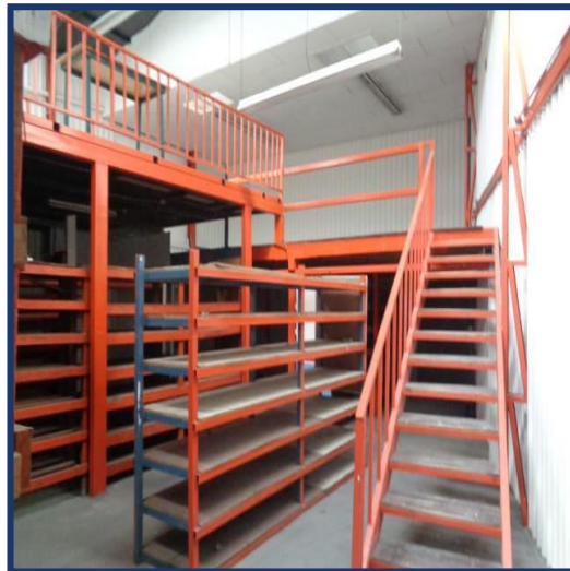
Vista Bodega y Mezzanine.