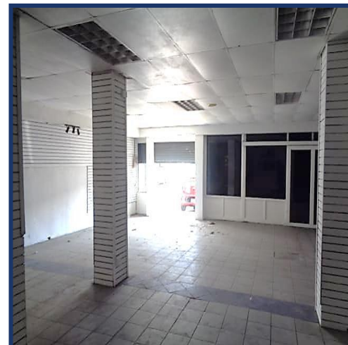
Vista entrada principal.