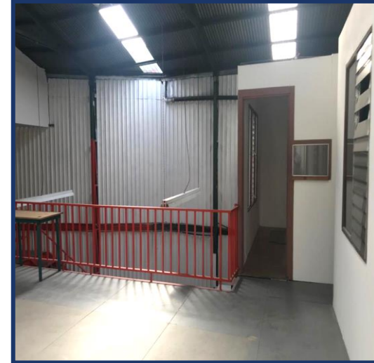
Otro ángulo mezzanine.