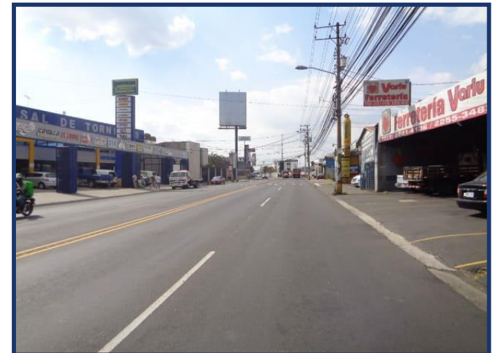
Vista sector inmediato