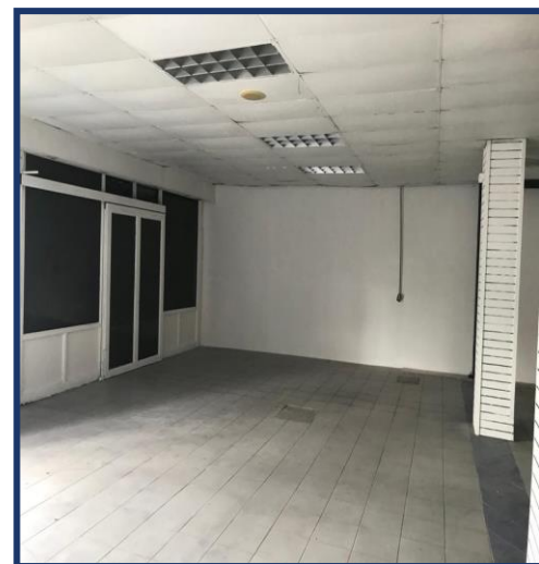
Sala Exhibición (Entrada principal)