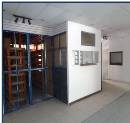
Vista entrada a Bodega.