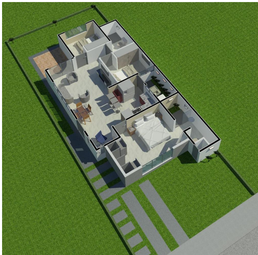
Modelo Cactus 3 hab 2 baños