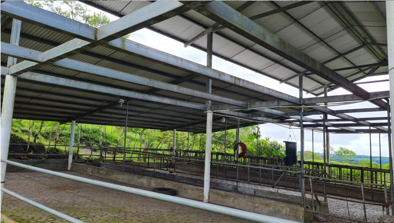
Imágenes de las instalaciones