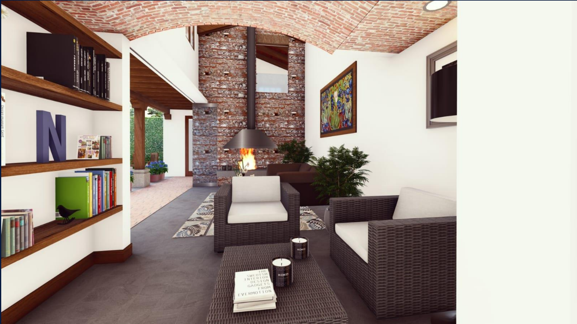
Dezain museum, Gort