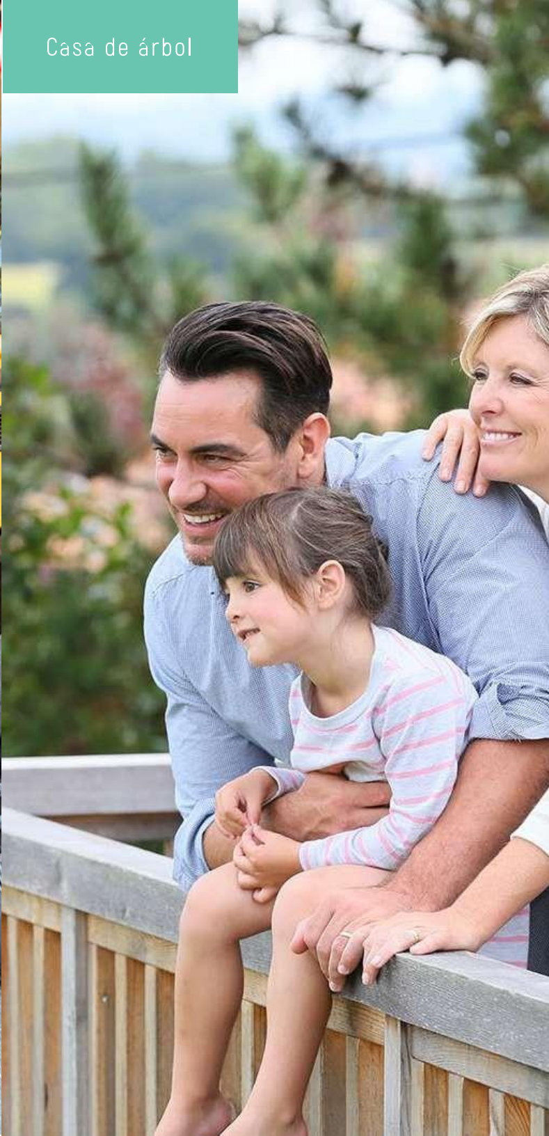
Casa de árbol