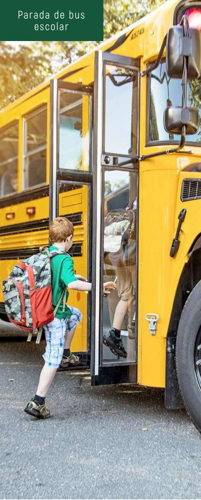
Parada de bus escolar