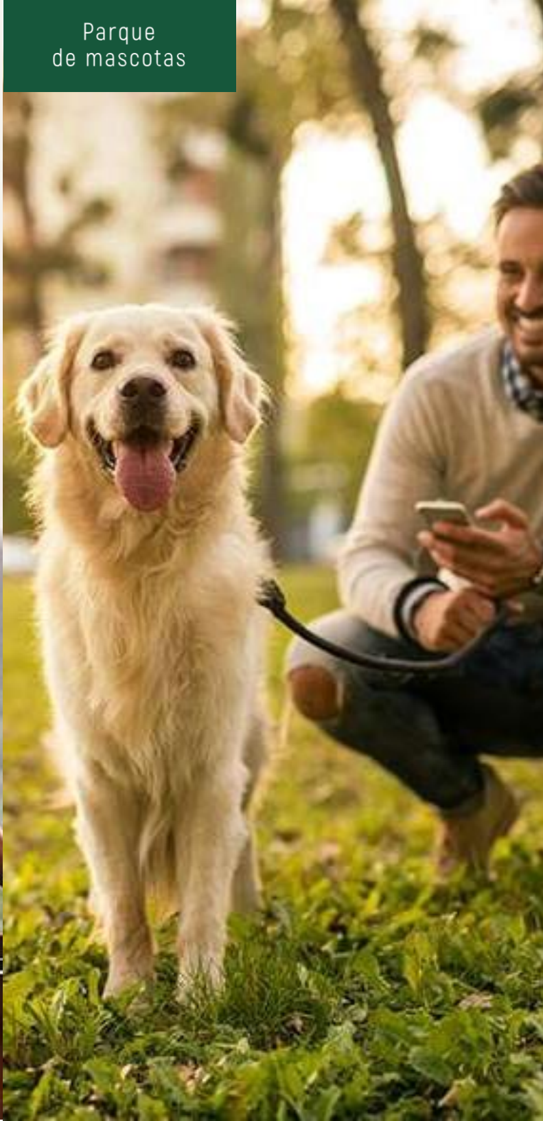
Parque de mascotas