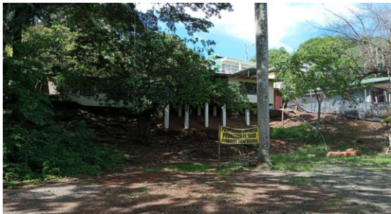
SECCION III INICIO ZONA ASCENDENTE