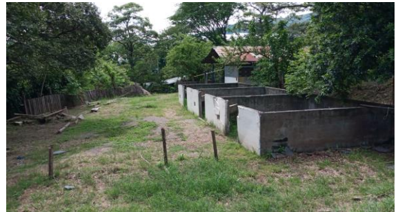
OTRAS CONSTRUCCIONES EXISTENTES