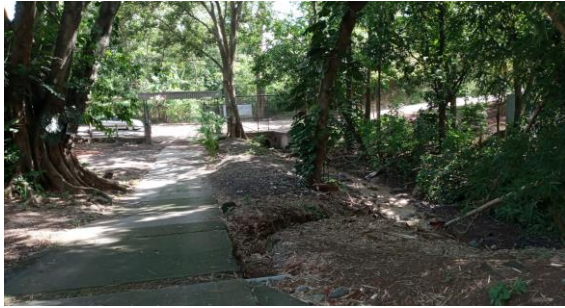
SECCION II (LEY FORESTAL)