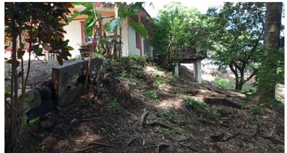
DETALLE DE PENDIENTE