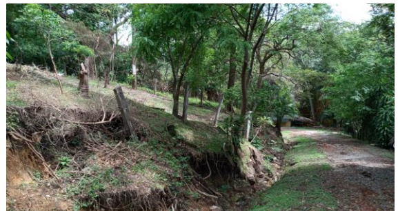
EVIDENCIA DE DESLIZAMIENTO INTERNO