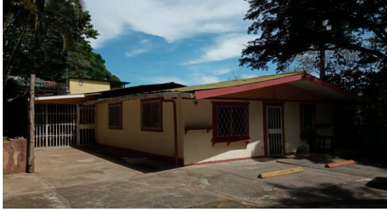
CASA DE HABITACION NO VALORADA