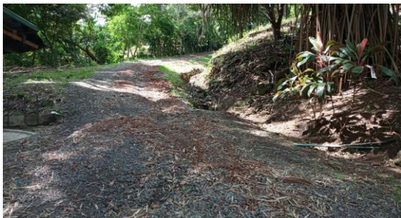
CALLE INTERNA LASTRE