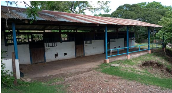
CABALLERIZAS/CUADRAS NO VALORADAS