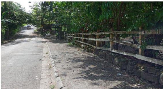
OBRAS URBANISTICAS/AMPLIACION VIAL