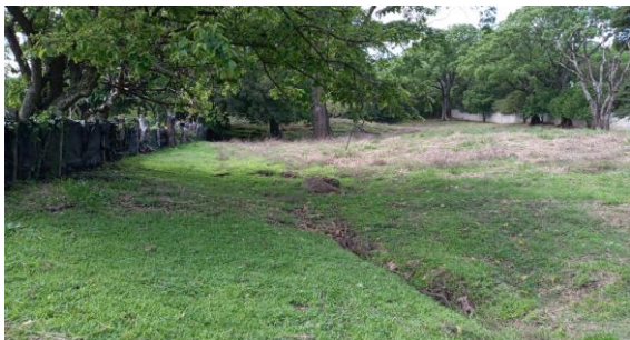
CANALES DE ESCORRENTIA