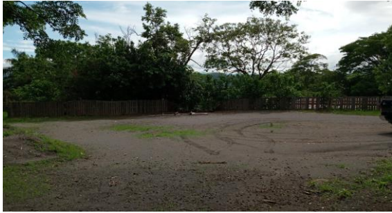
SECCION IV (TERRAZA EXISTENTE)