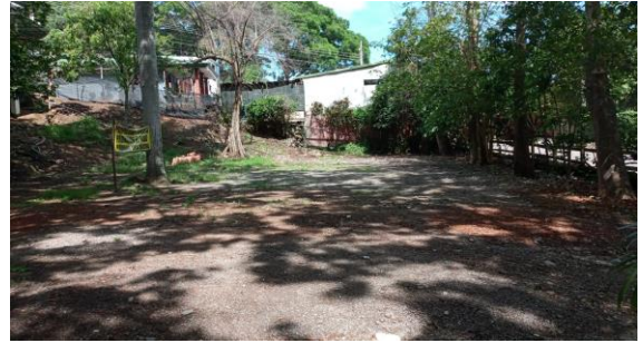
SECCION III TOPOGRAFIA PLANA