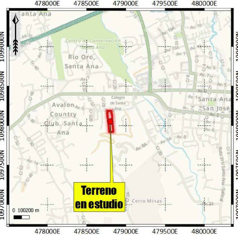
DIAGRAMA DE UBICACIÓN GENERAL