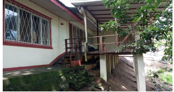
CASA DE HABITACION NO VALORADA