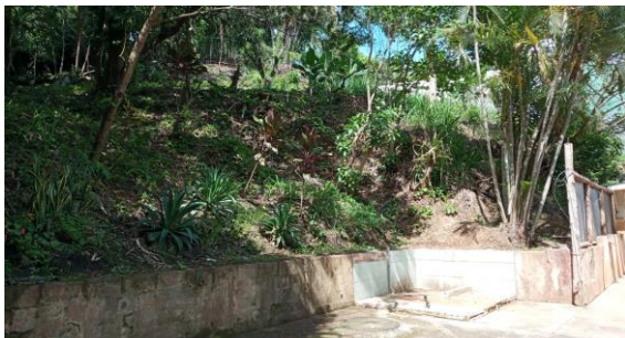
SECCION III CON TOPOGRAFIA QUEBRADA