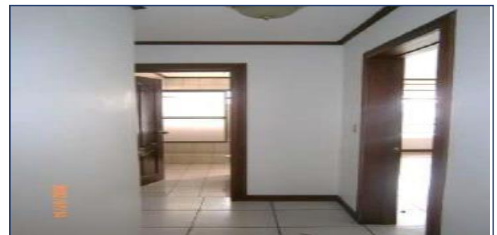
Vista pasillos apartamentos segunda planta.