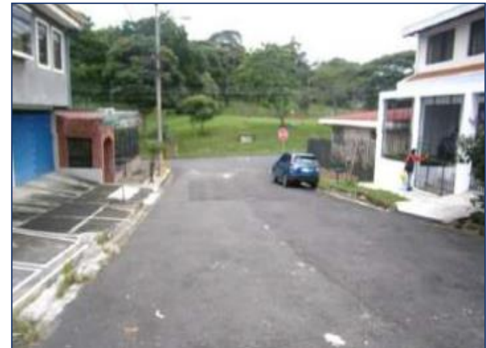
Otra vista del entorno inmediato.