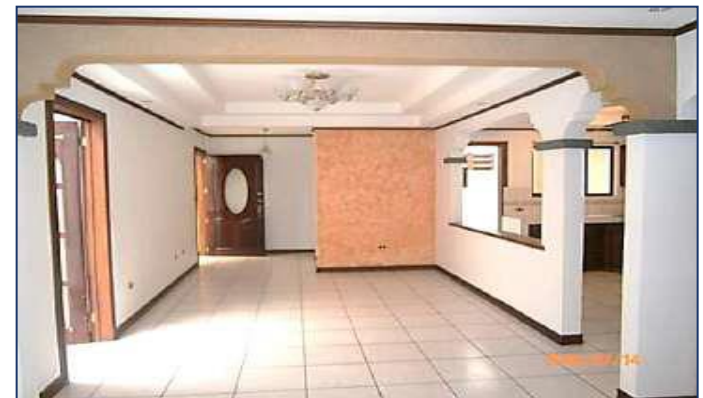
Vista de la sala