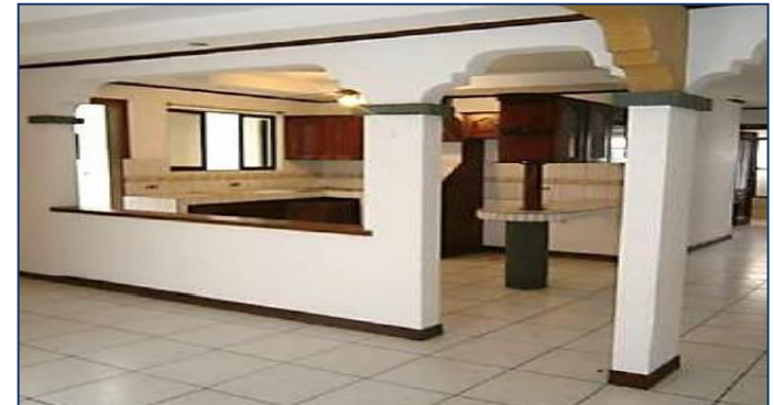
Vista planta alta.