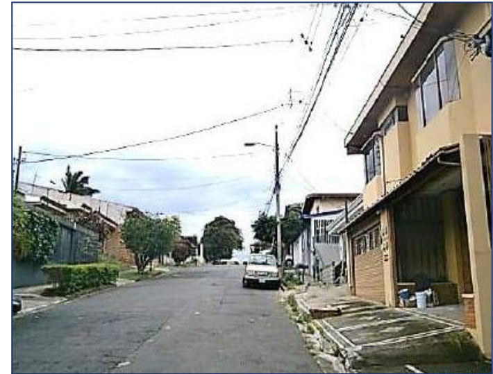
Vista del entorno inmediato.