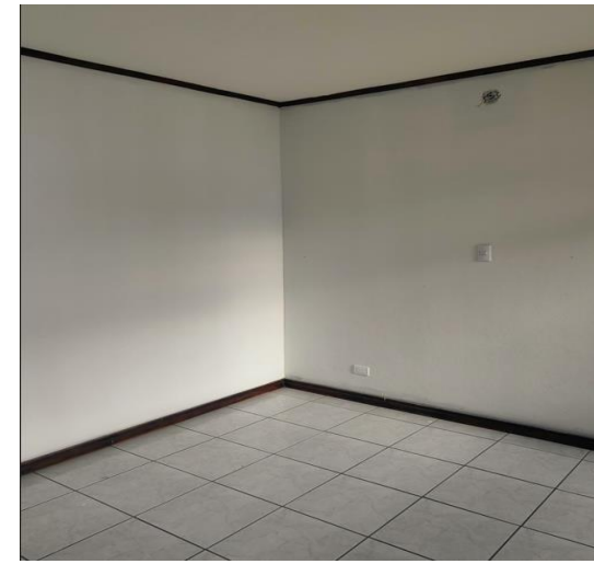
Vista de dormitorio