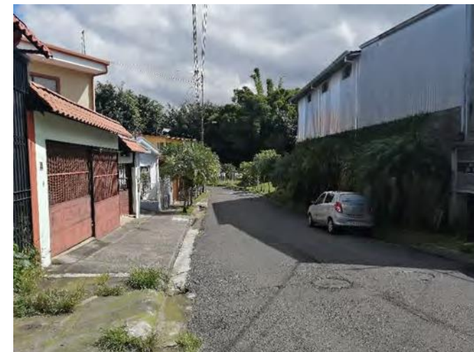
Vista entorno inmediato