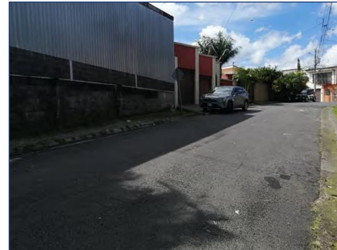
Vista entorno inmediato