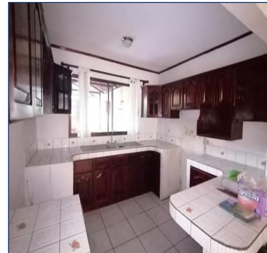
Vista de cocina