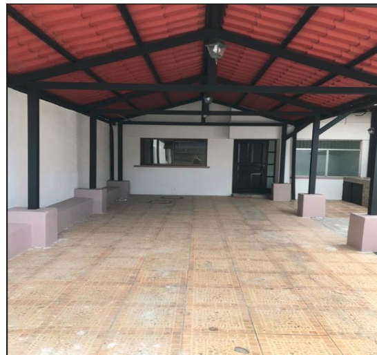
Vista de cochera