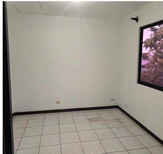
Vista de dormitorio