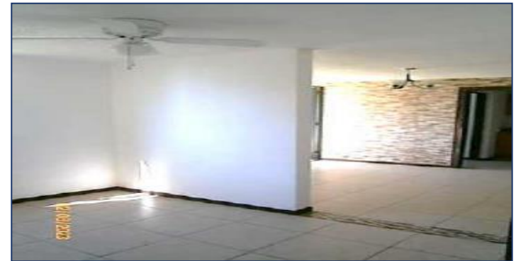
Vista Sala de TV