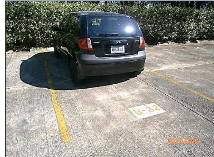
Vista frontal parqueo B-3 2.