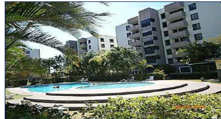
Vista de piscina.