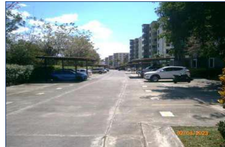
Vista entorno del estacionamiento.