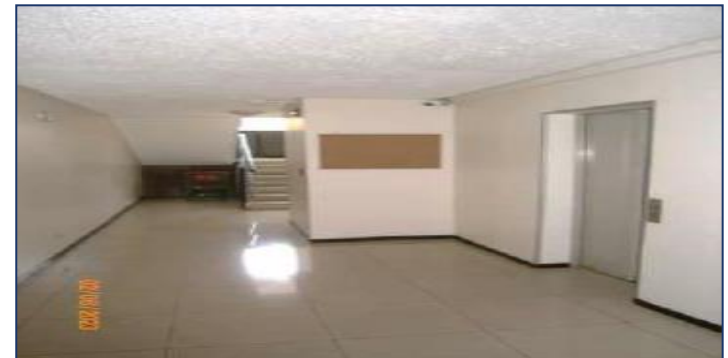
Vista áreas comunes pasillos aledaños