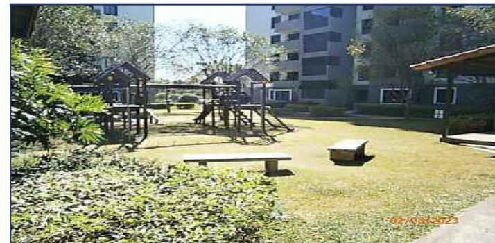
Vista áreas comunes, juegos infantiles.