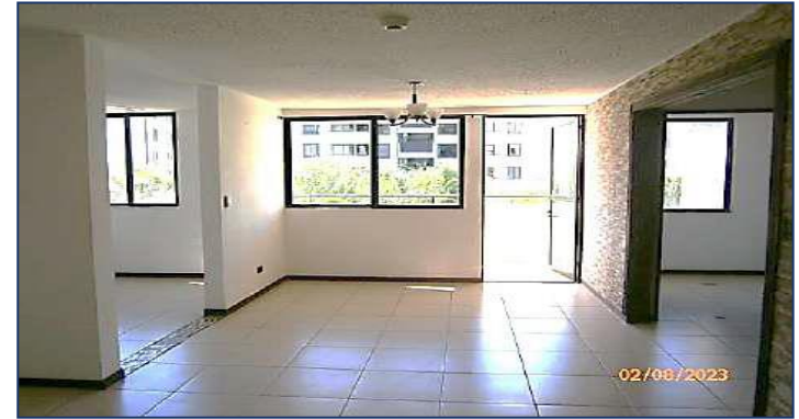
Vista hacia el balcón.

• Las áreas comunes aledañas comprenden pasillos con pisos de cerámica, cielos lisos de concreto, ducto de escaleras y ascensores, así como escaleras de emergencia.