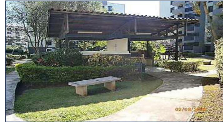
Vista áreas comunes del condominio.