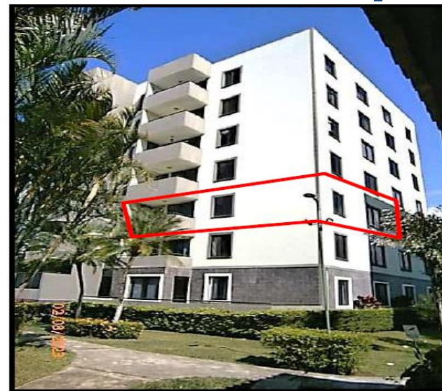
Vista Edificio y Apartamento B-3 2 en piso 3.

El inmueble se localiza específicamente en el Condominio Vertical Residencial Paso Real; ubicado exactamente del peaje de la Ruta 27 sobre marginal norte, aproximadamente 650 metros al noreste, específicamente en el Complejo de Condominios denominado Campo Real.