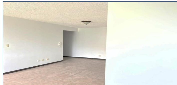
Vista de sala