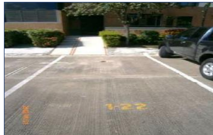
Vista espacio de estacionamiento.