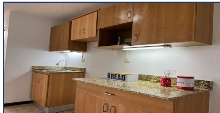
Vista de cocina