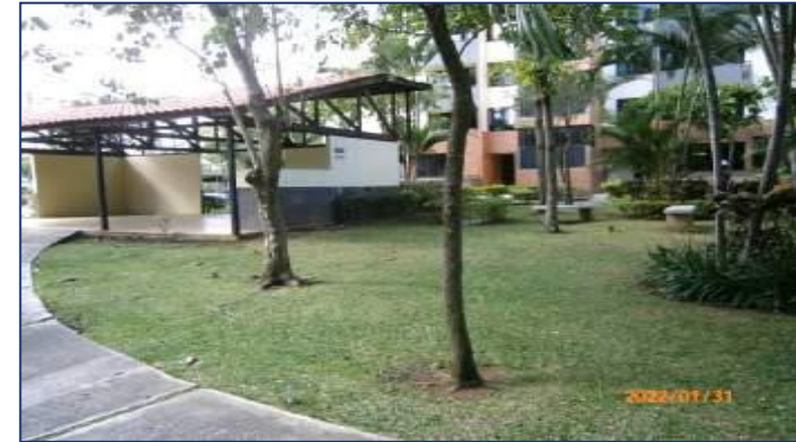
Vista áreas comunes del condominio.