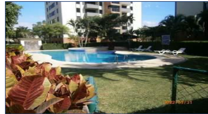
Vista de piscina.