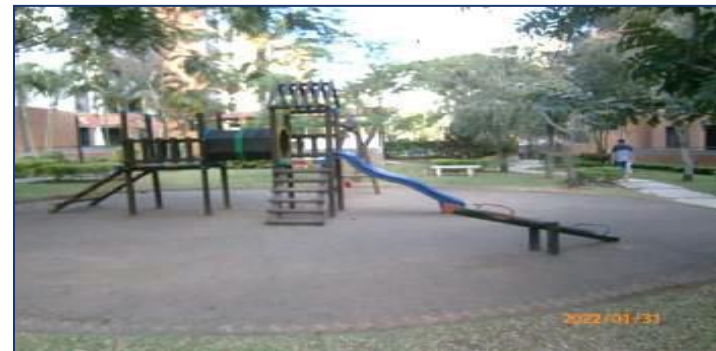
Vista áreas comunes, juegos infantiles.