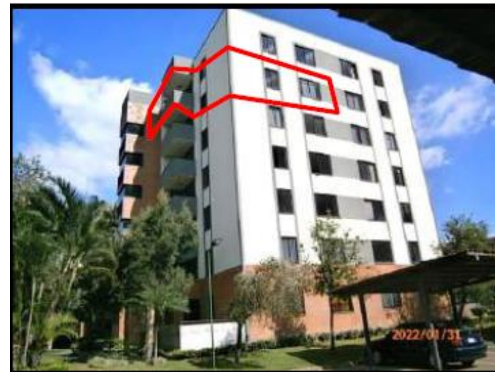
Vista Edificio y Apartamento 1-22 en piso 6.

El inmueble se localiza específicamente en el Condominio Vertical Residencial Bosque Real 1; ubicado exactamente del peaje de la Ruta 27 sobre marginal norte, aproximadamente 650 metros al noreste, específicamente en el Complejo de Condominios denominado Campo Real.