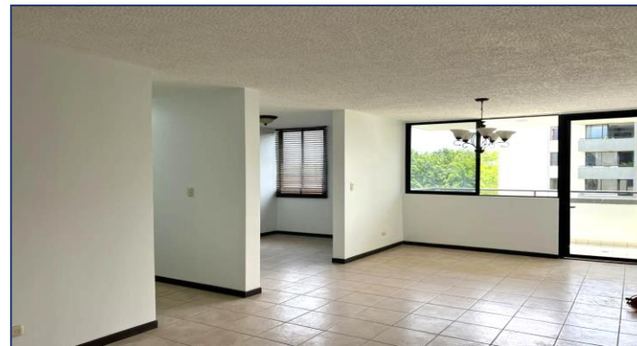
Vista hacia el balcón.