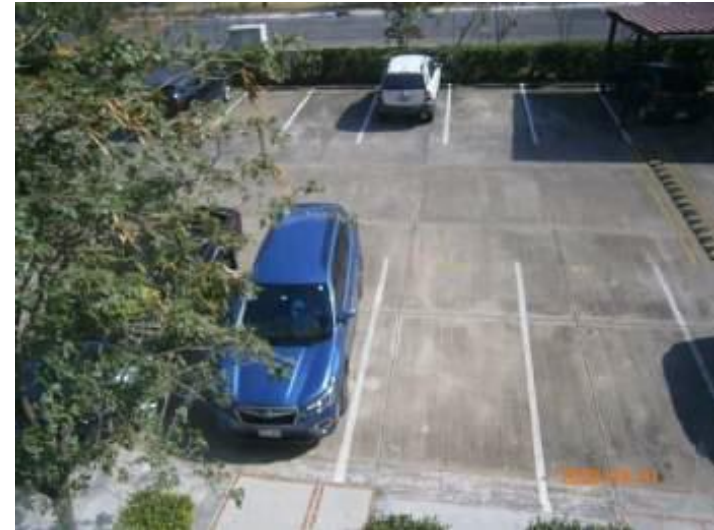
Vista superior de estacionamiento.