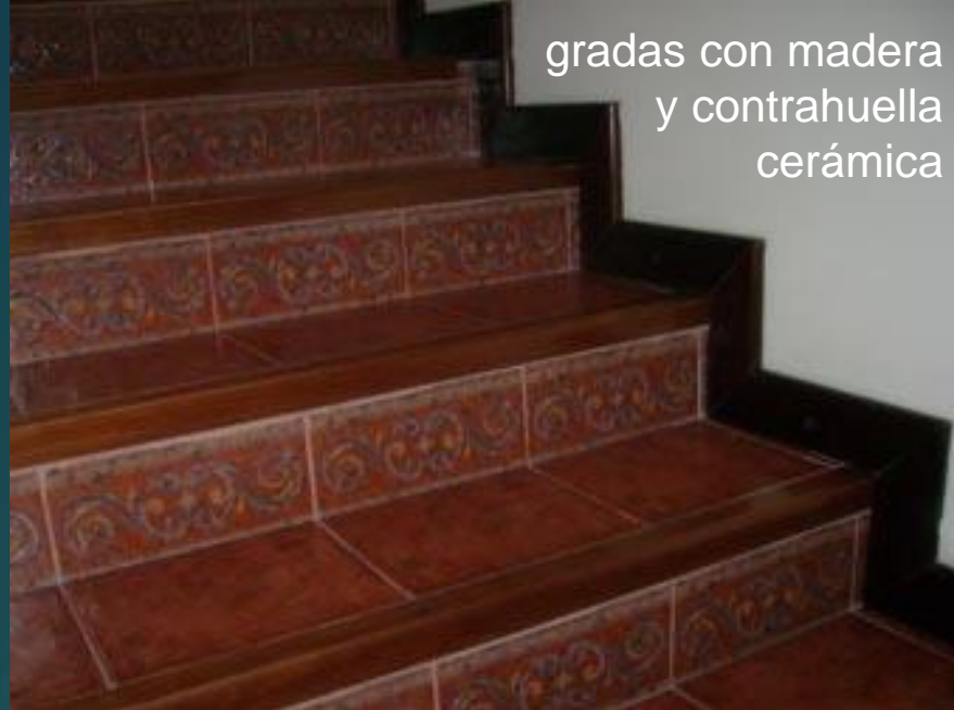
gradas con madera y contrahuella cerámica