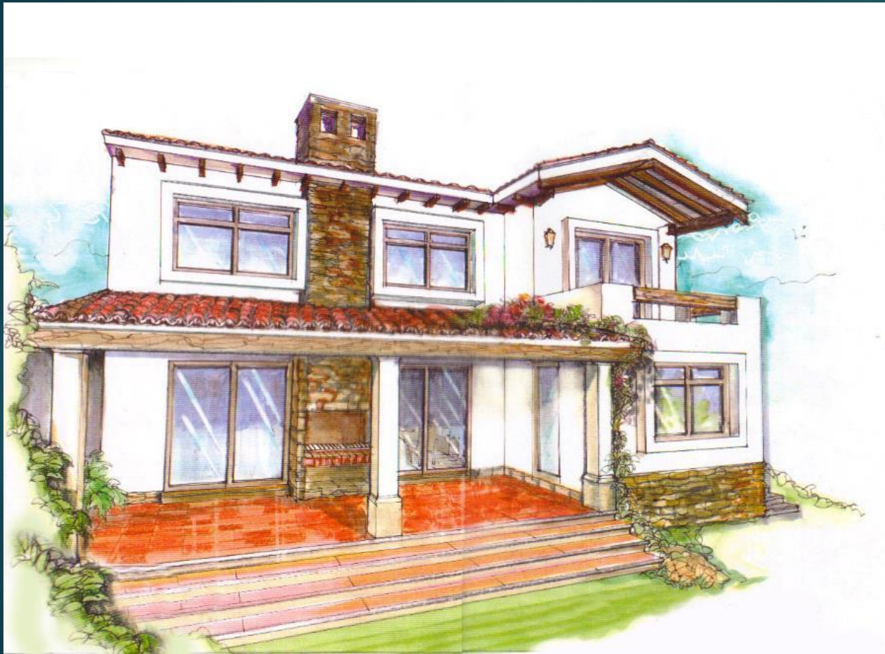
Casa km.12.7 Car. a El Salvador La Encantada II