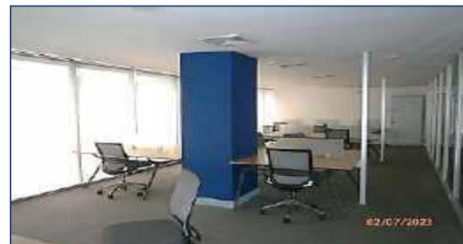
Vista interna oficinas.