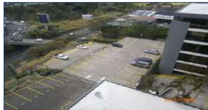
Vista aérea condominio y estacionamientos