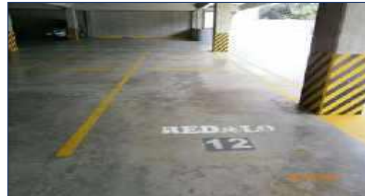
Vista de estacionamientos.