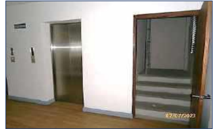
Área común ascensores