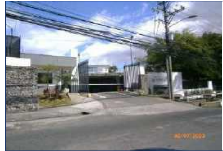
Entrada oeste Oficentro La Virgen.