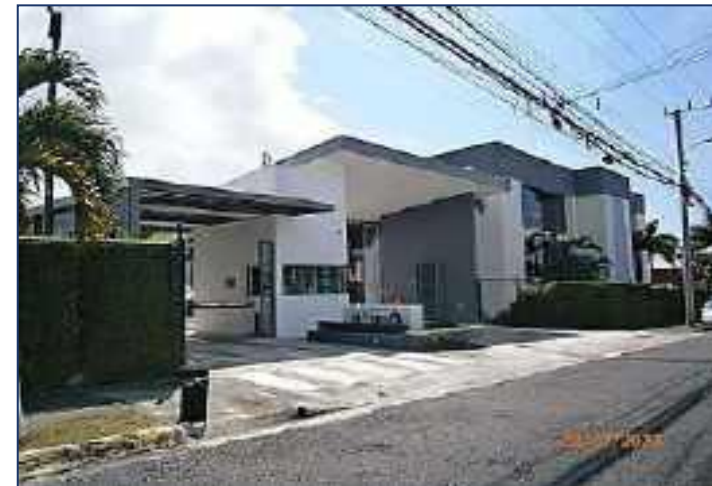
Entrada norte Oficentro La Virgen