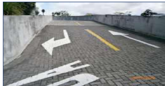
Área común de estacionamiento y rampas