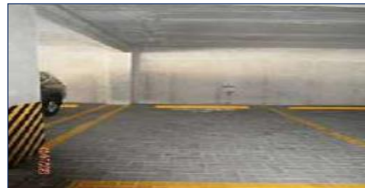
Vista de estacionamientos.