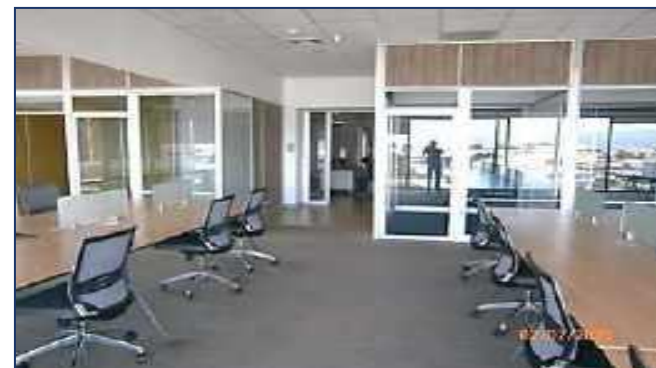
Vista interna oficinas.