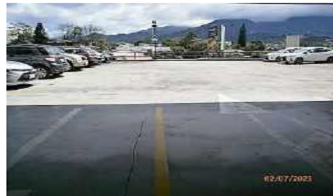
Área común de estacionamiento