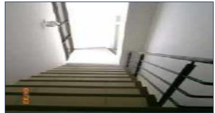
Vista área común escaleras