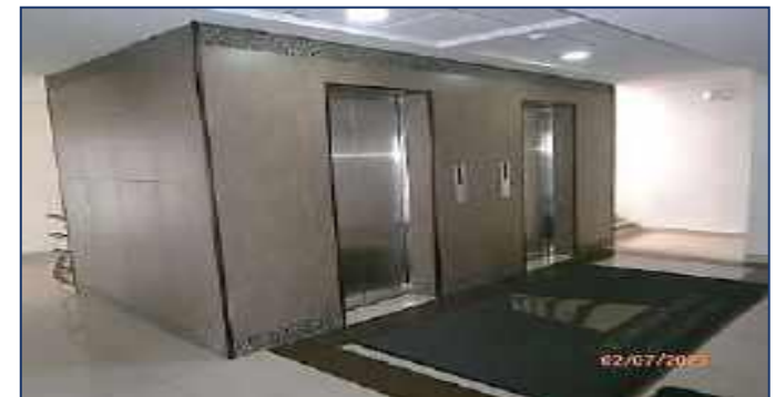
Vista interior pasillos y ascensores