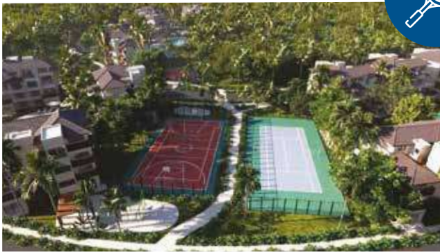
Practica tu deporte favorito en nuestras canchas multipropósito