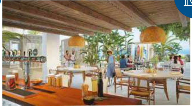
Prueba un plato diferente cada día en nuestros deliciosos restaurantes