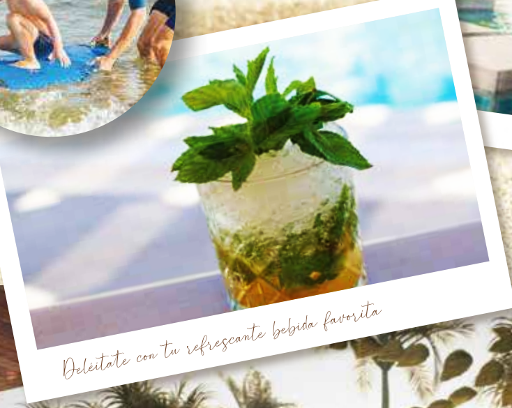
Deléitate con tu refrescante bebida favorita