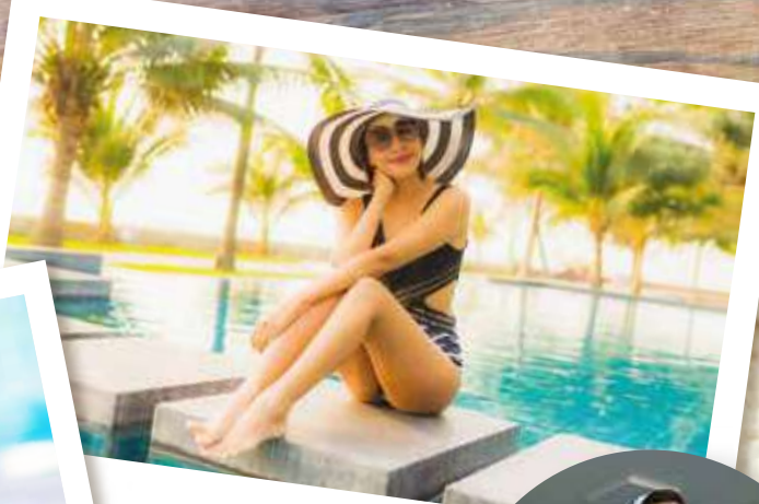
Mantente en forma