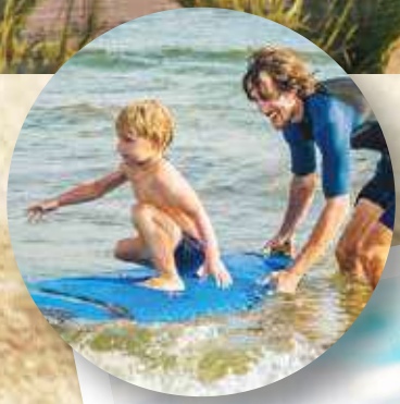
Disfruta de actividades para todos los gustos