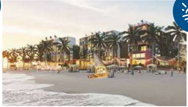
Más de 1 km de playa donde los rayos del sol y el sonido de las olas te acompañan