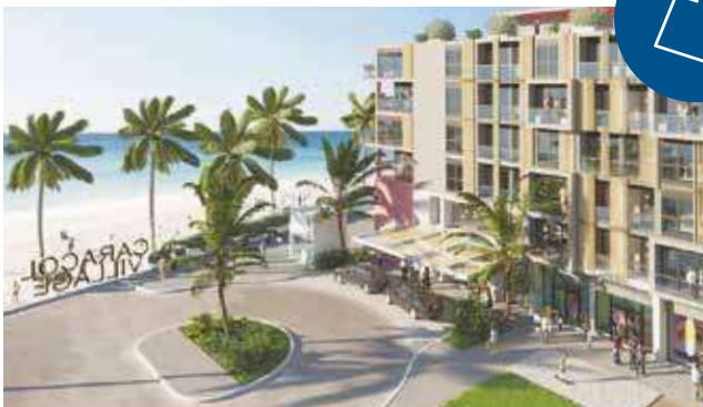
Caracol Village: Tu punto de encuentro para shopping, compartir y disfrutar