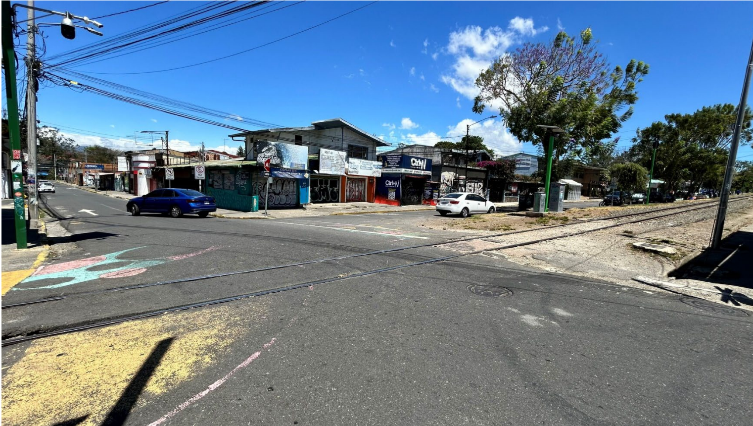
Detalles de la zona.