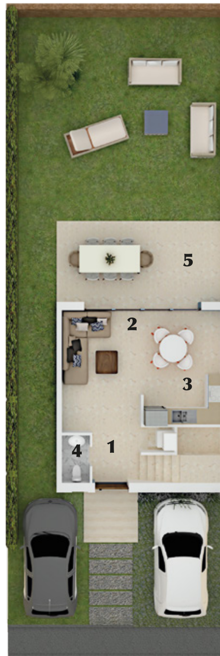
PLANTA NIVEL 1