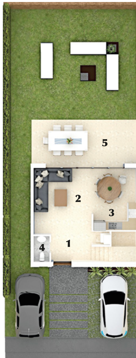
PLANTA NIVEL 1