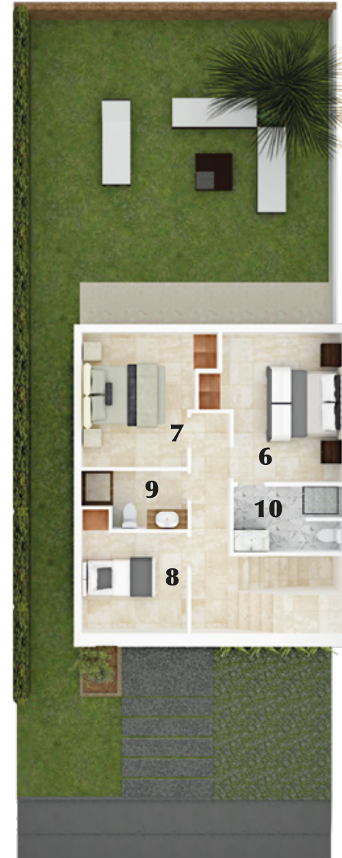
PLANTA NIVEL 2