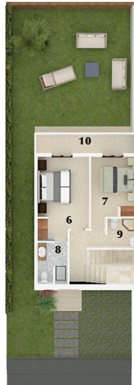
PLANTA NIVEL 2