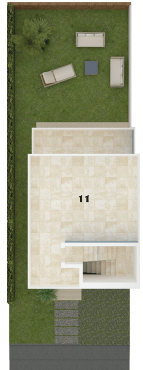
PLANTA NIVEL 3