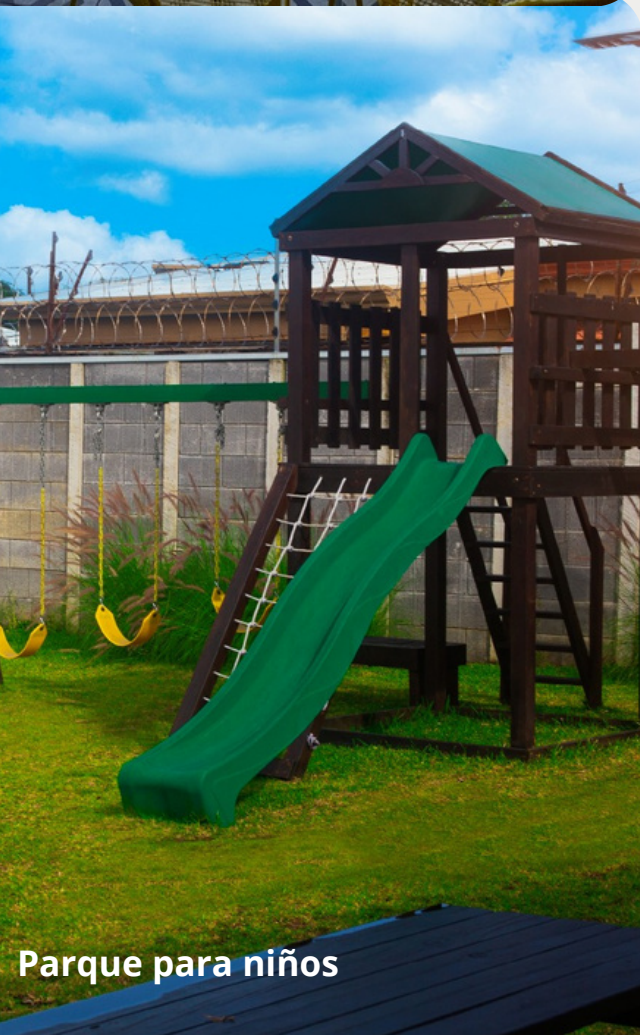
Parque para niños