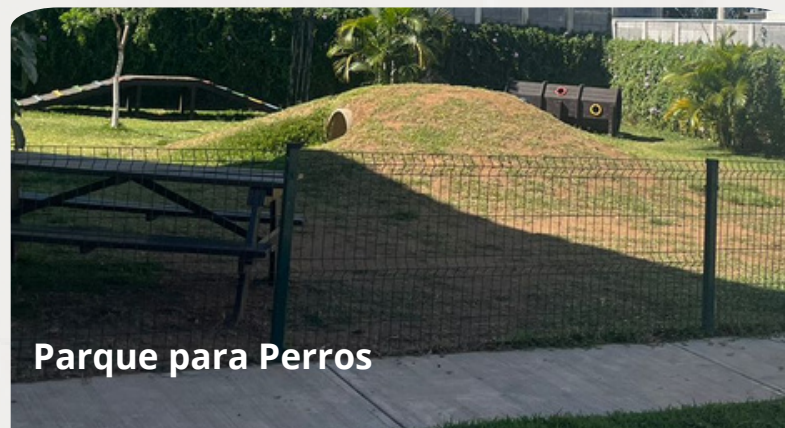
Parque para Perros