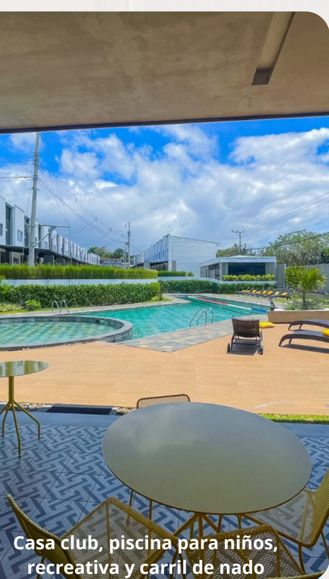
Casa club, piscina para niños, recreativa y carril de nado