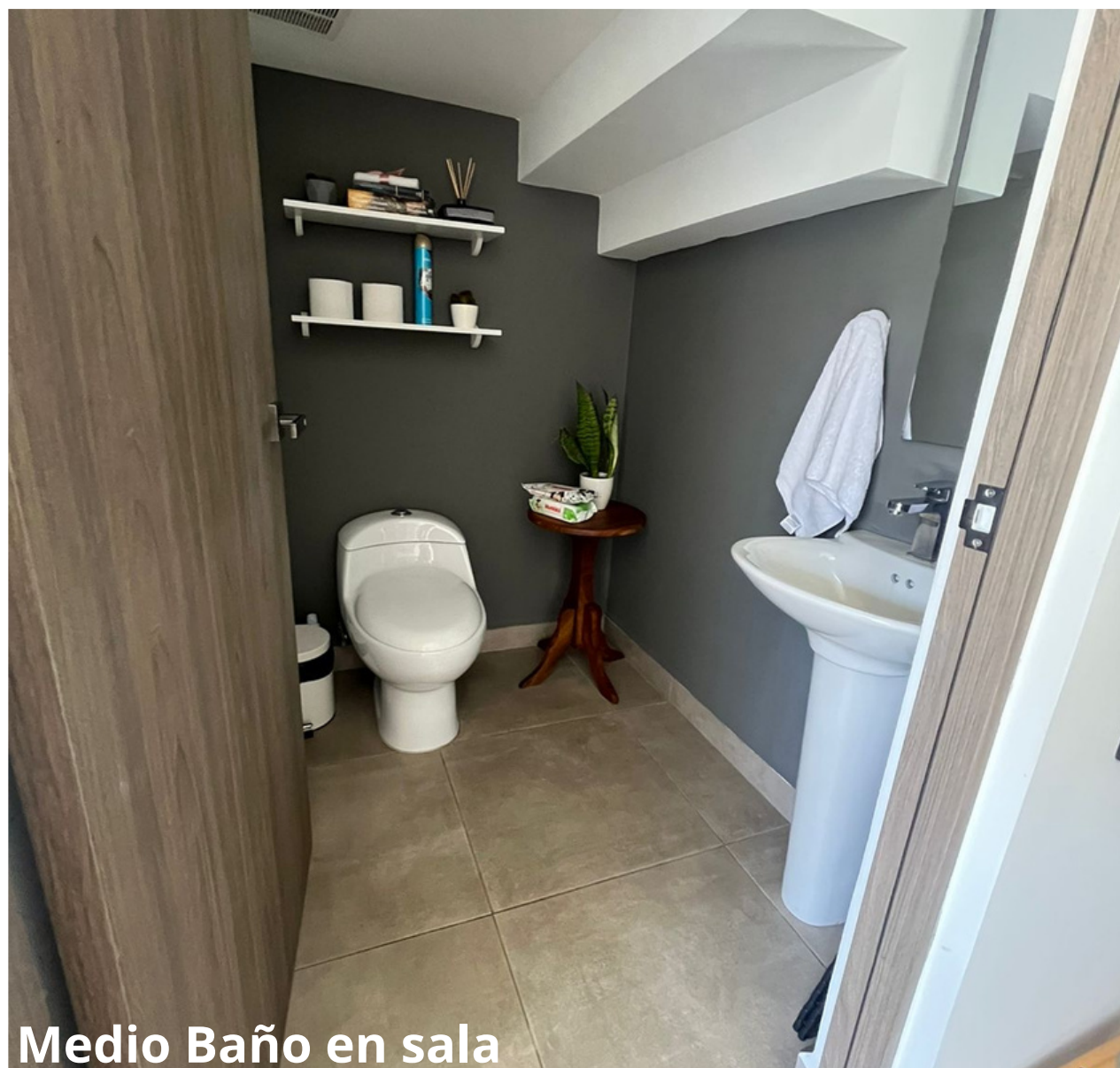
Medio Baño en sala