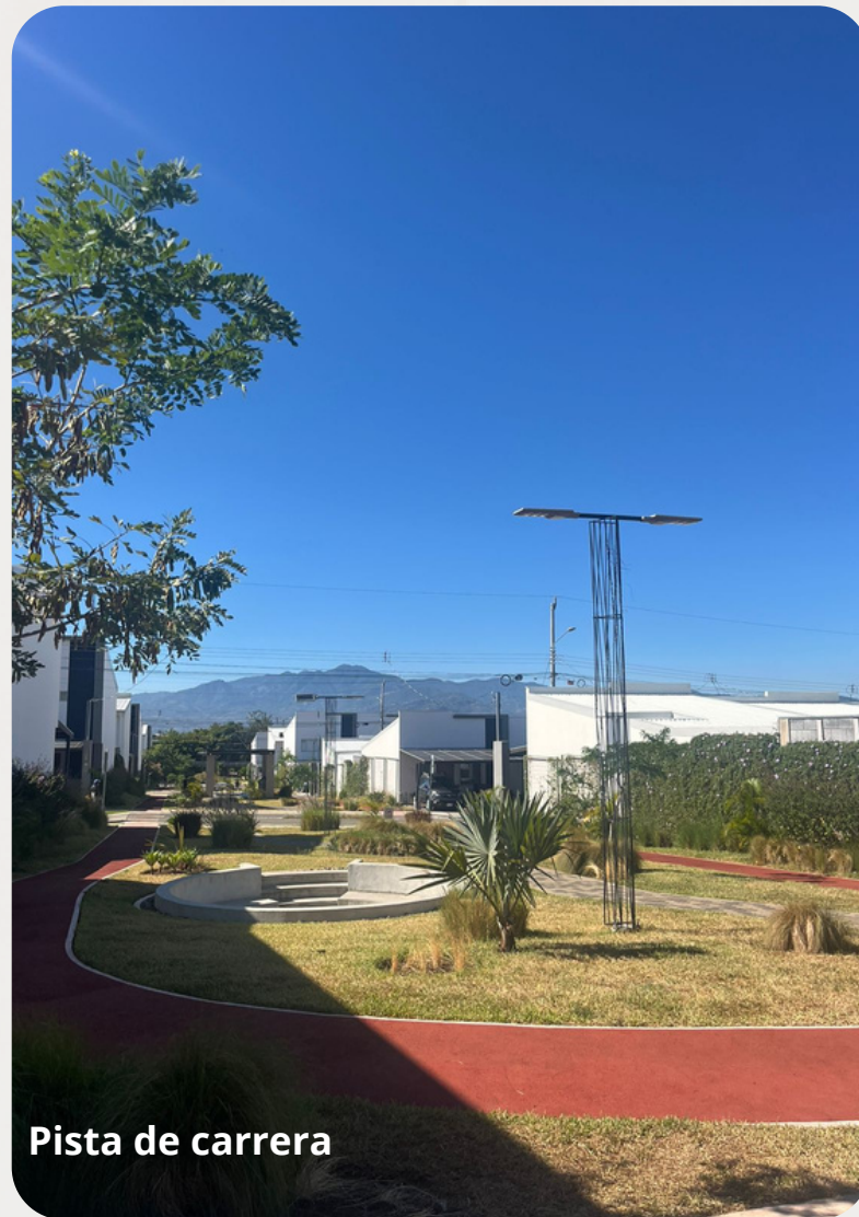
Pista de carrera