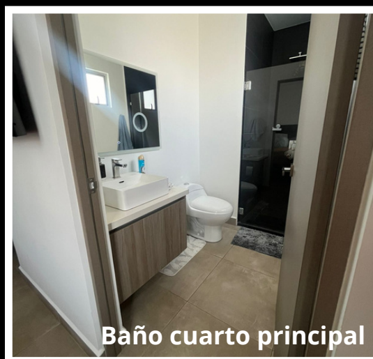
Baño cuarto principal