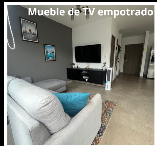
Mueble de TV empotrado