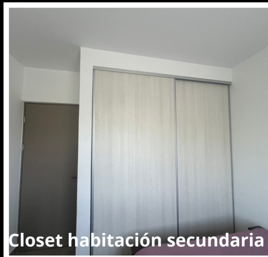
Closet habitación secundaria