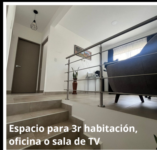
Espacio para 3r habitación, oficina o sala de TV