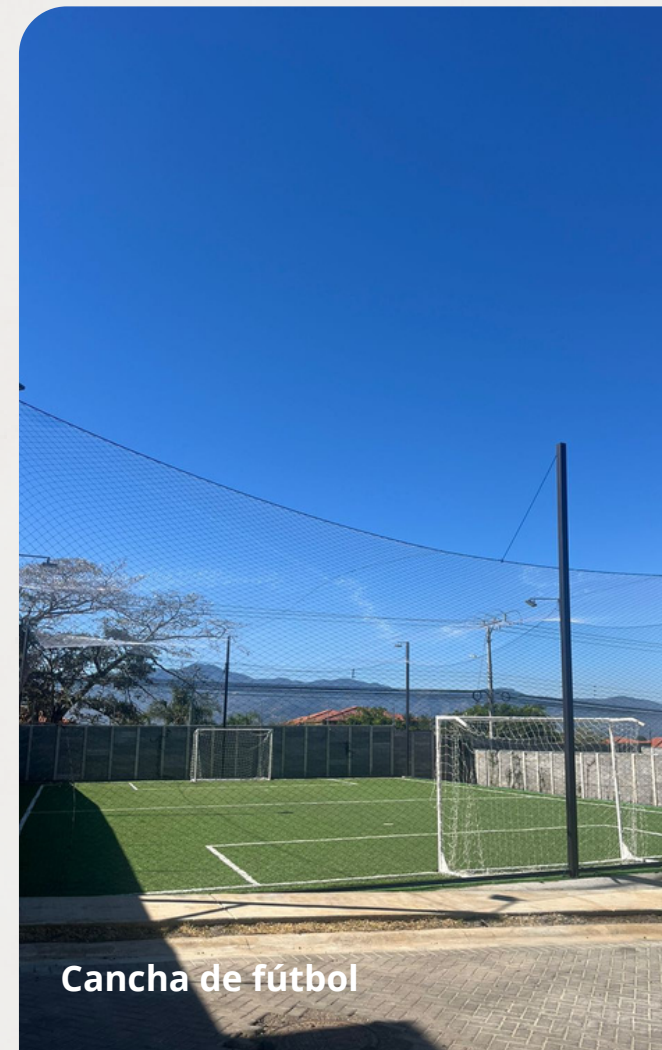
Cancha de fútbol