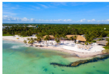
PLAYA BLANCA 15 MIN