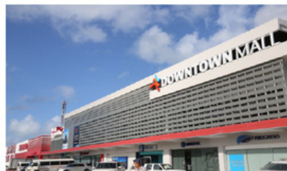
DOWNTOWN MALL 10 MIN