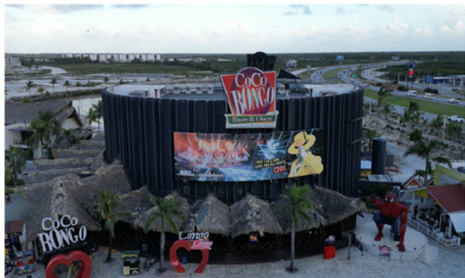
COCO BONGO 10 MIN