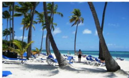
PLAYA BIBIJAGUA 18 MIN