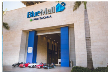
BLUE MALL 14 MIN