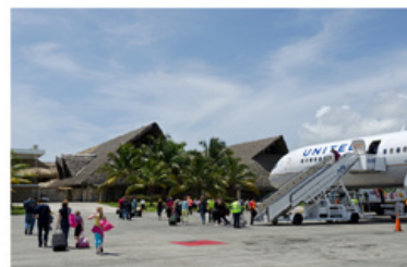
AEROPUERTO INT. Punta Cana 10 MIN