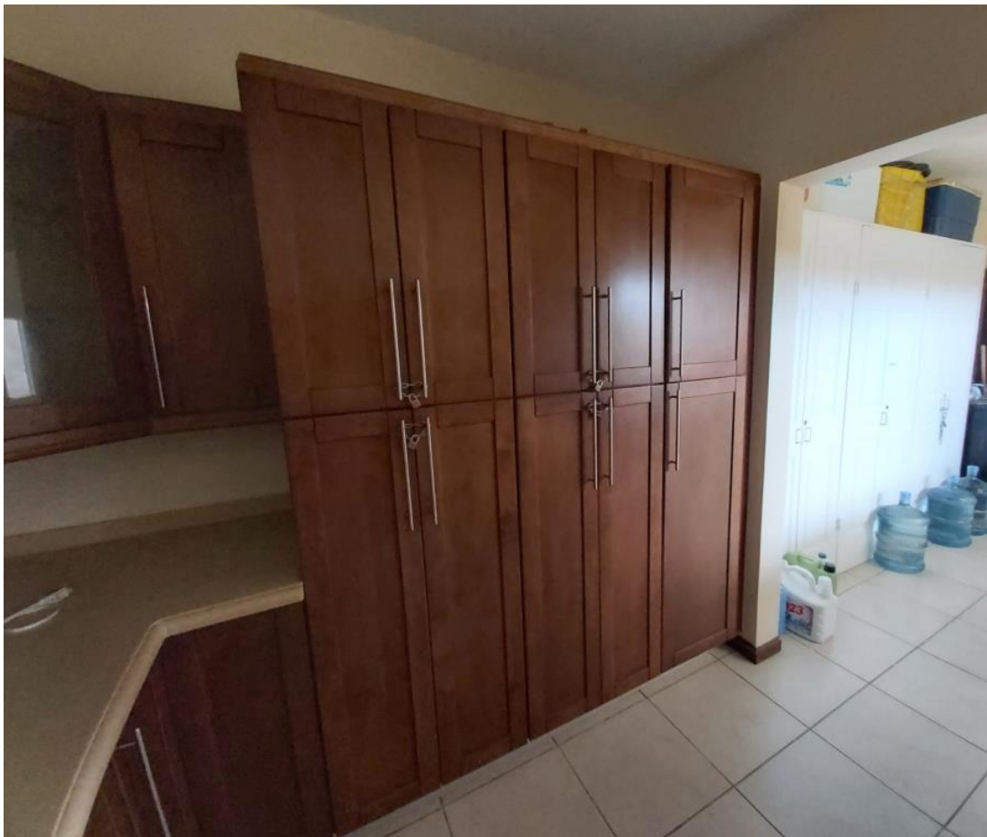
Amplia cocina con gabinetes