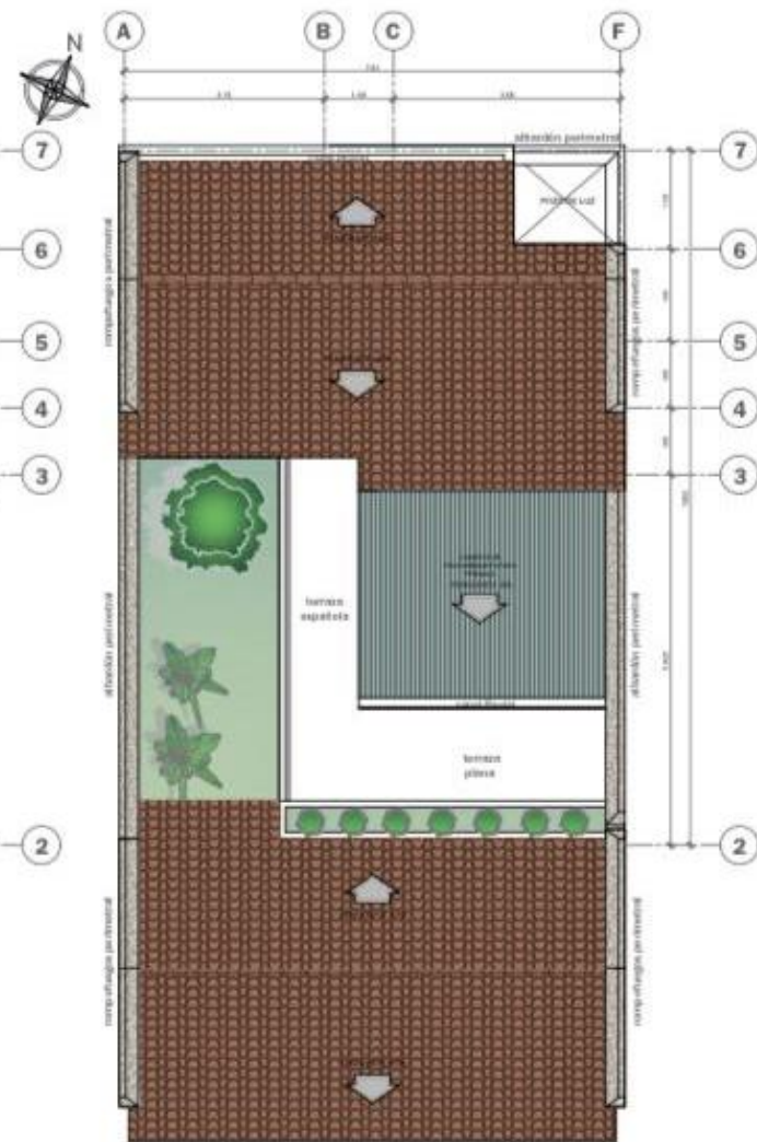
PLANTA DE TECHOS - -LOTE 6 SECTOR B, CLUB RESIDENCIAL LOS FRANCISCANOS- ESCALA 1/50