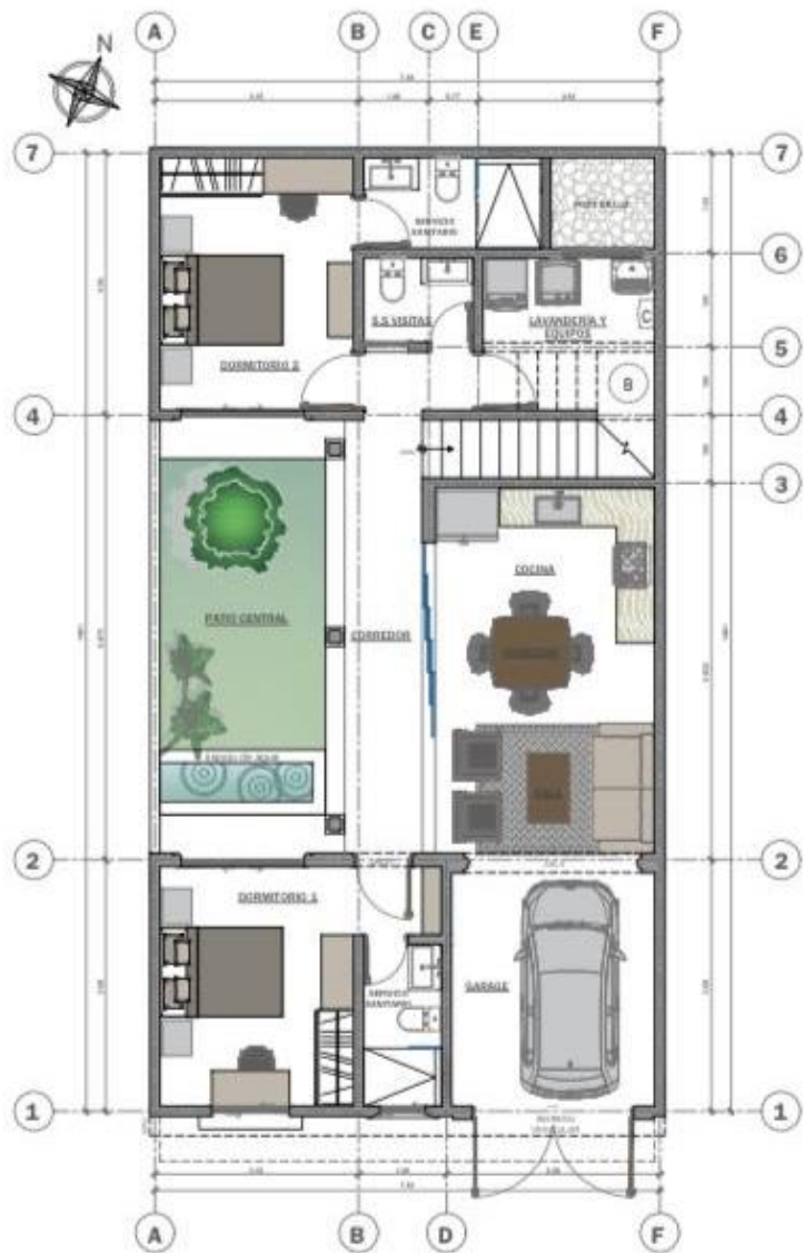
PLANTA BAJA ARQUITECTÓNICA - -LOTE 6 SECTOR B, CLUB RESIDENCIAL LOS FRANCISCANOS- ESCALA 1/50