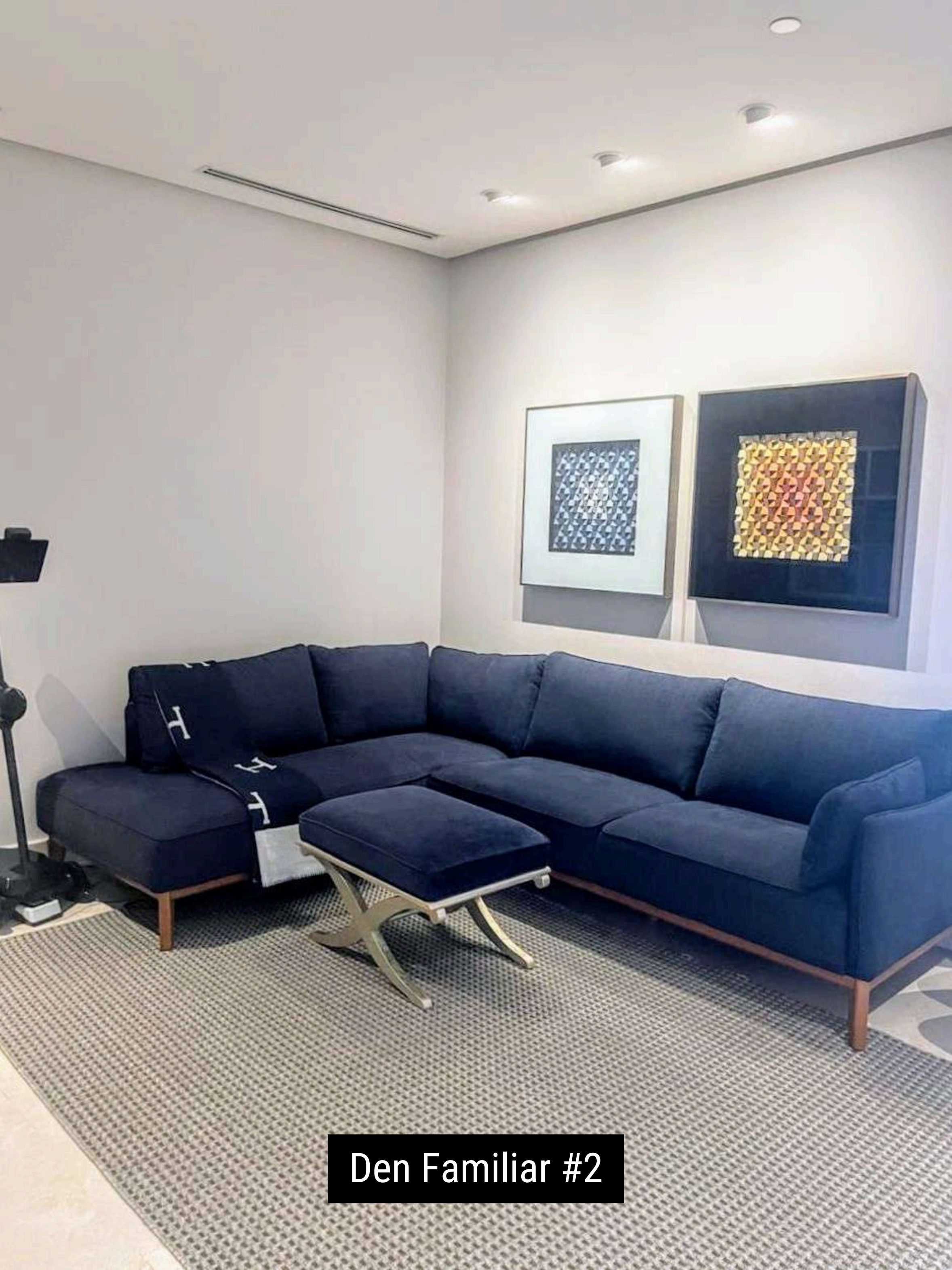
Den Familiar #2