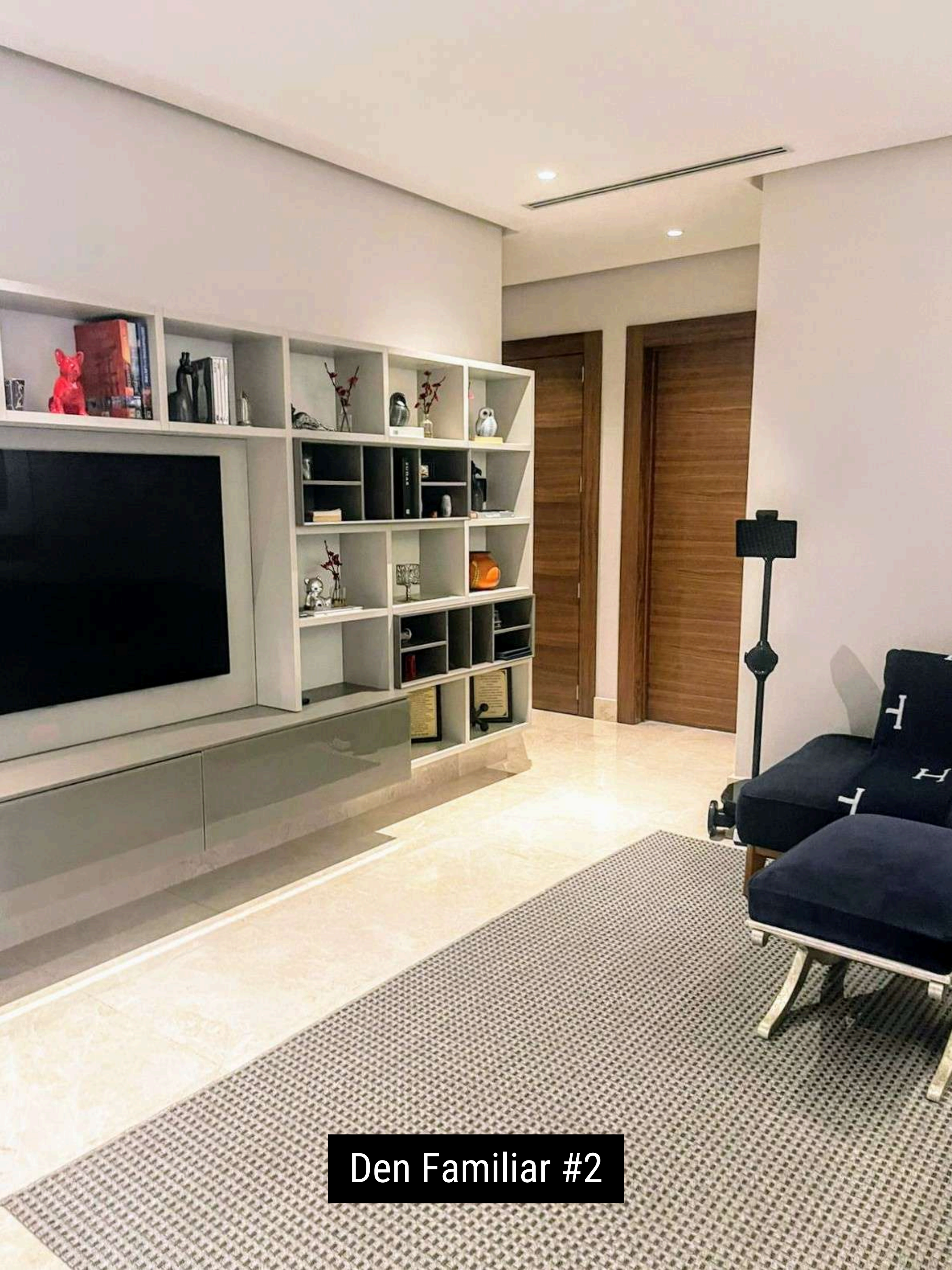
Den Familiar #2