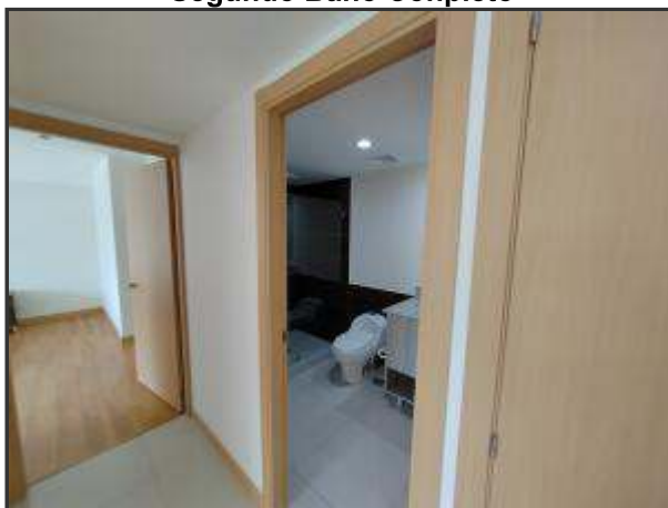
Segundo Baño Completo