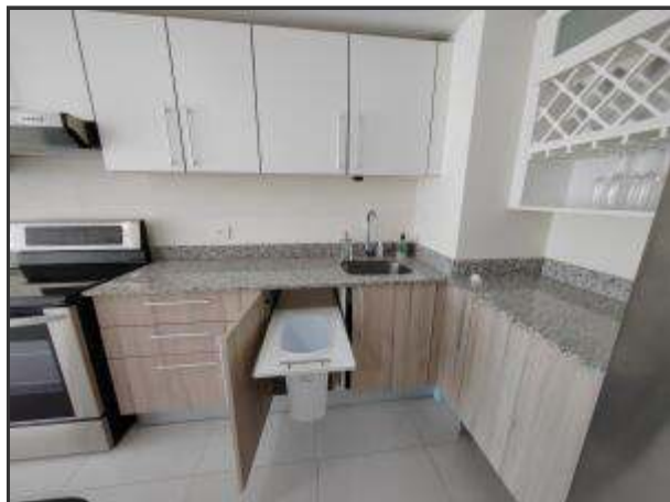
Mueble de Cocina