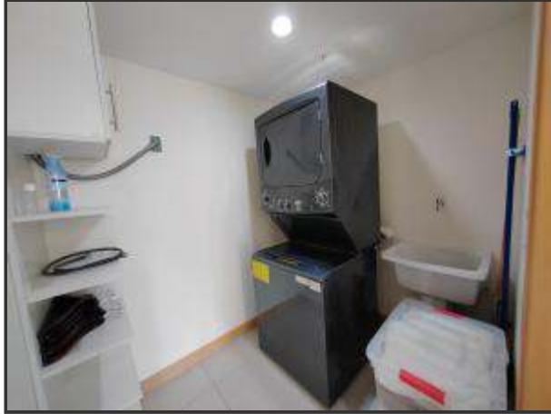
Cuarto de Lavado