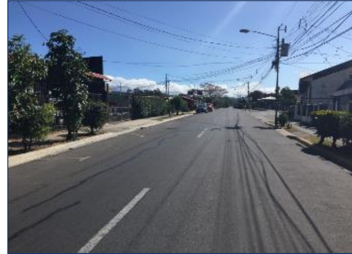
Vista del entorno