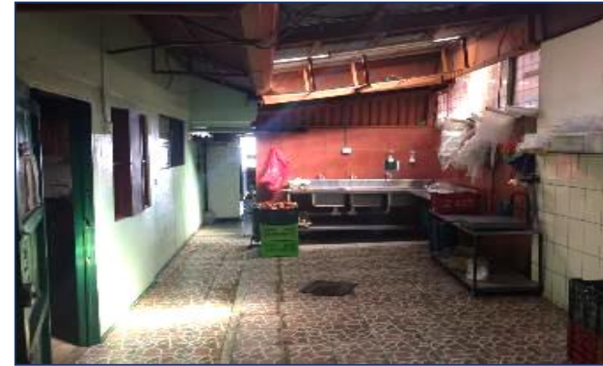
Espacio primera planta