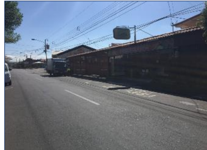
Vista entorno inmediato