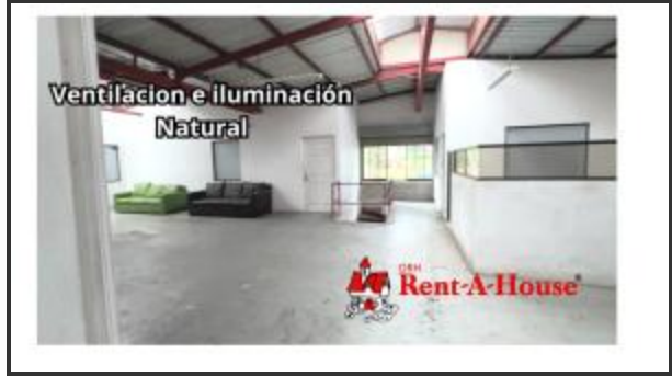
AREA 2DO NIVEL