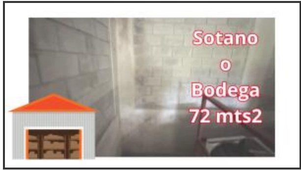
BODEGA O SOTANO