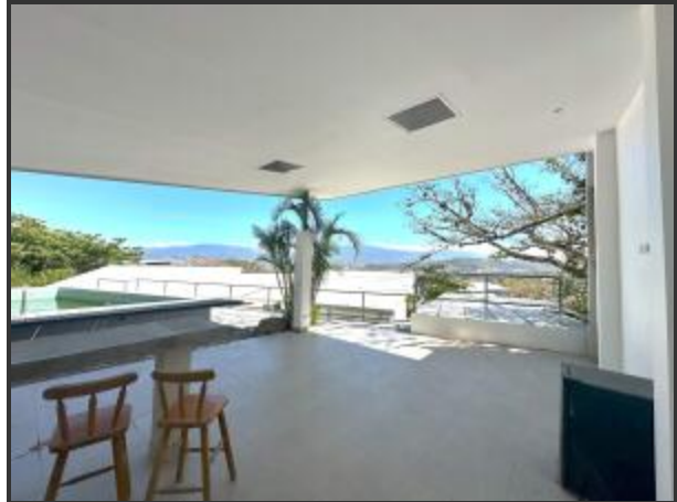
Area Social Independiente