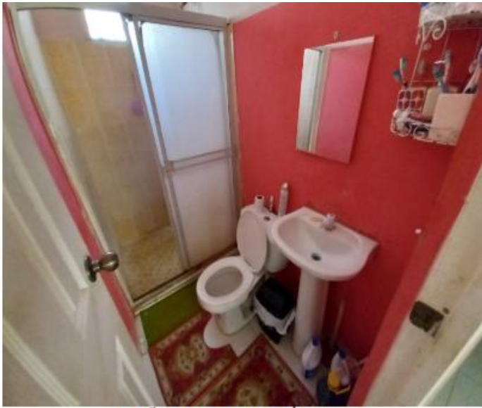
BAÑO DE USO MÚLTIPLE