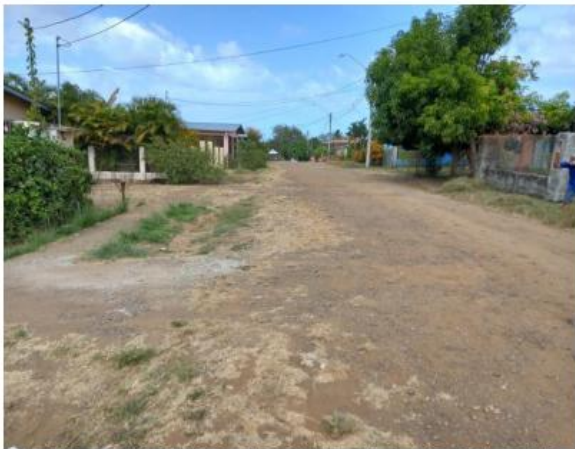
CALLE TERCERA FRENTE A LA PROPIEDAD