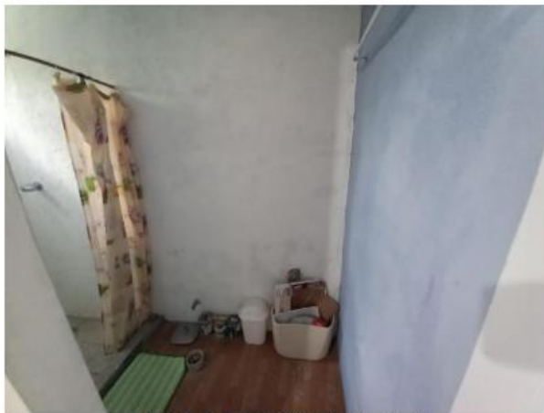
BAÑO DE RECÁMARA No.3