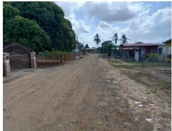
CALLE TERCERA FRENTE A LA PROPIEDAD