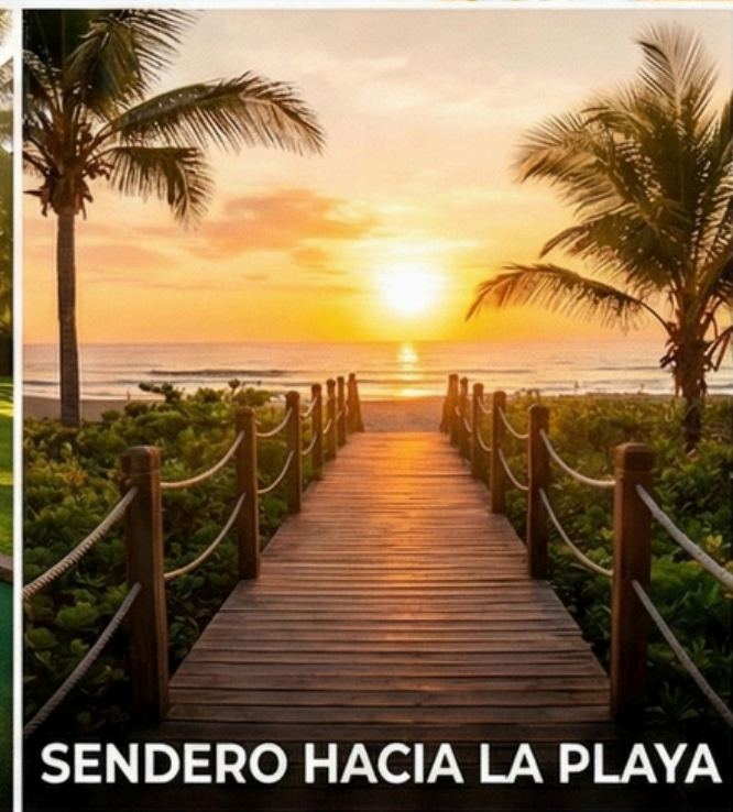
SENDERO HACIA LA PLAYA