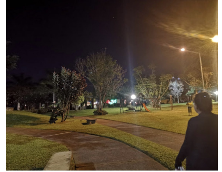
Iluminación segura nocturna