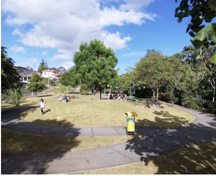
Parques verdes durante el día