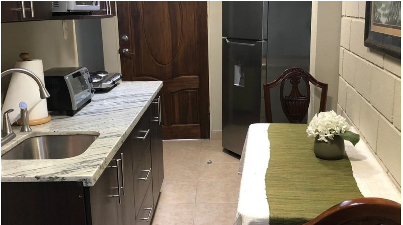
Cocina con sobre de granito, refrigeradora y comedor integrado