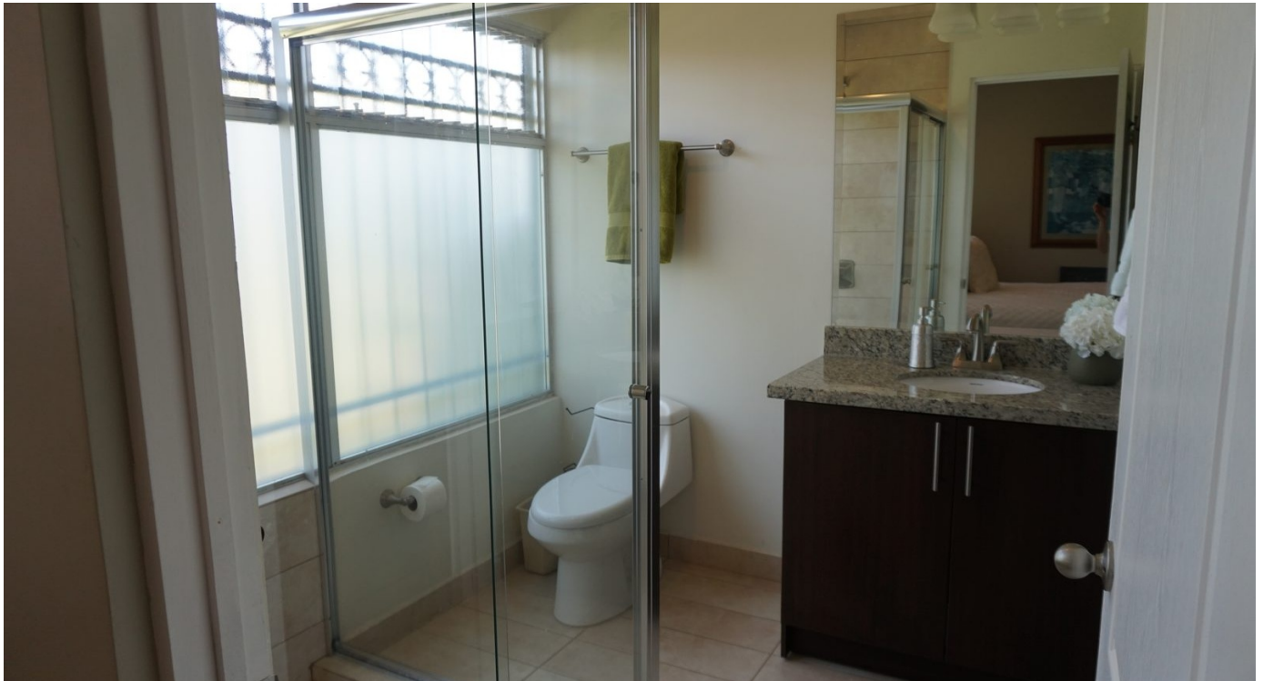
Baño completo con sobre de granito y ducha de vidrio