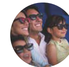
2017 Cinepolis Dorado Mall