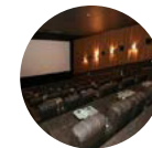
2015 Cinepolis VIP Soho Mall