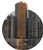
1996 Villa Marina

El comienzo de un sueño que hoy lleva más de 30 años. Medterrané, fue nuestro primer proyecto en construcción, en su momento, uno de las torres más altas de Panamá