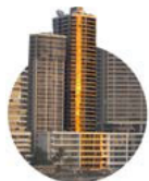
1993 Mar de Plata