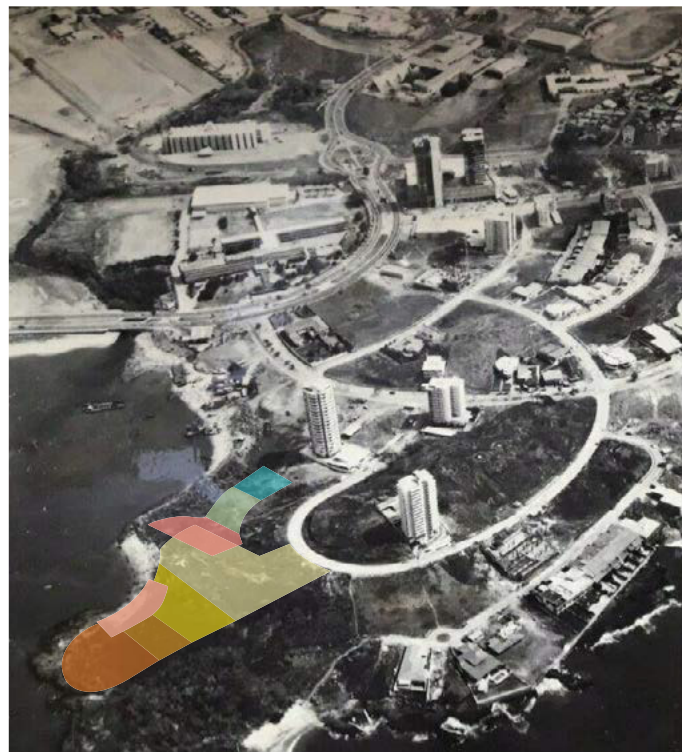
Bahía de Panamá 1965

Este espíritu pionero ha convertido a Desarrollo Bahía en referente indiscutible del sector inmobiliario y de la construcción, elevando continuamente los estándares y definiendo el futuro del urbanismo en Panamá.