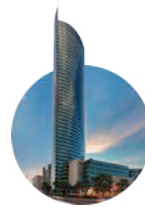
2015 Financial Park