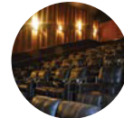
2013 Cinepolis Westland mall