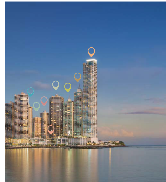
Bahía de Panamá 2018