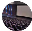
2011 Cinepolis Metromall

Llega Cinépolis a Panamá de la mano de Desarrollo Bahía. Primera sala de Cine con pantallas de última tecnología del país