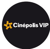
2011 VIP Multiplaza

Introducción al mundo comercial tenemos parte de la construcción del Centro Comercial más lujoso, grande y reconocido del país.