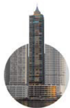
2004 Punta Roca