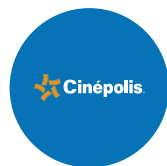
2008 Cinepolis MP