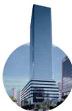
1998 Plaza Banco General

Primera torre de oficinas de lujo en la ciudad, ubicada donde se centran todos los negocios, el área bancaria.