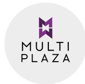
2008 C.C. Multiplaza Pacific

Introducción al mundo comercial tenemos parte de la construcción del Centro Comercial más lujoso, grande y reconocido del país.