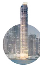
2012 The Point

Elegante torre icónica gestionada por Corex como el proyecto residencial más alto de latinoamérica.