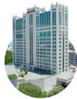
1998 Hotel Marriott Panamá

Desarrollo Bahía pone un pie en el mundo de la hotelería marcando la diferencia con el primer lujo y gran hotel Marriott, el primero del país.