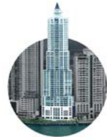
2003 Bahía Pacífica

Desarrollo Bahía pone un pie en el mundo de la hotelería marcando la diferencia con el primer lujo y gran hotel Marriott, el primero del país.