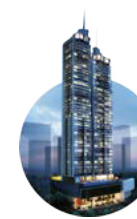
2020 The Towers