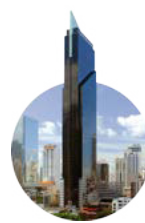
2012 Tower Financial Center

Elegante torre icónica gestionada por Corex como el proyecto residencial más alto de latinoamérica.