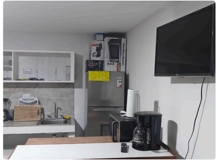
Electrodomésticos: Área de entretenimiento con Smart TV y cafetera nueva