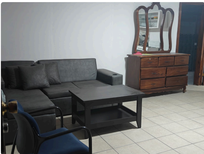
Mueble y Sofá: Confortable sofá modular y elegante juego de espejo clásico