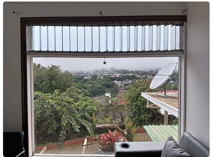
Sala Ventanal: Sala de estar amueblada con amplio ventanal panorámico de día