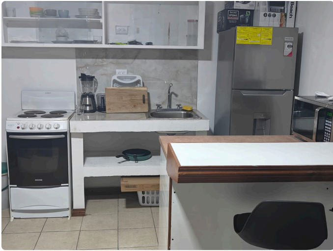
Cocina: Cocina equipada con plantilla, extractor y muebles aéreos