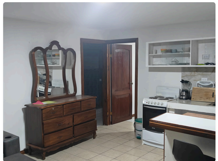
Distribución Abierta: Distribución e integración fluida de los espacios