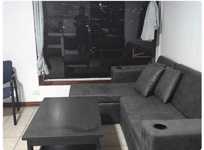
Vista Escazú: Vista espectacular de día hacia las montañas de Escazú