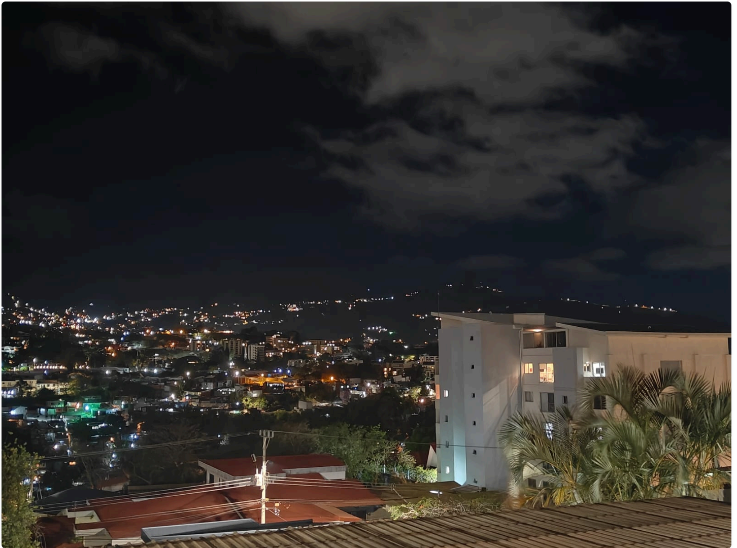
Vista Nocturna Escazú: Patio/Balcón con acceso directo y la impresionante vista nocturna iluminada de todo Escazú