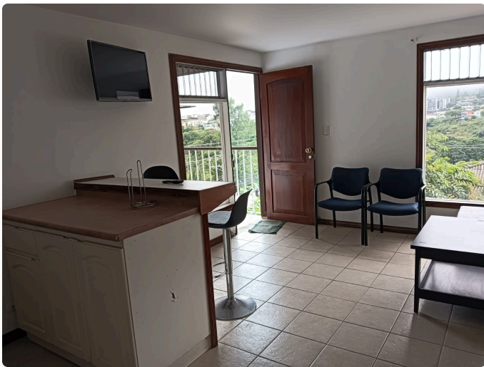
Entrada: Puerta de acceso principal en madera maciza y balcón