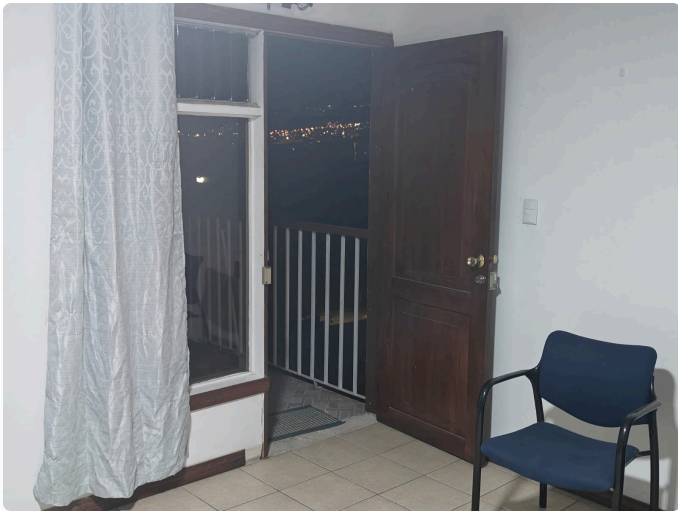
Barra Desayunadora: Barra desayunadora moderna con banquetas estilizadas