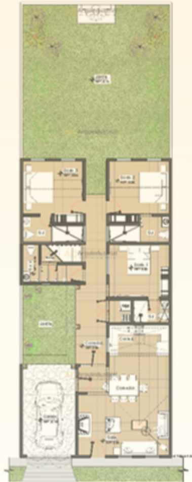
1 Planta Baja - Amoblada Casa Mariposa - Sector F - Lote 2 ESCALA 1:100

US$414,000.00 Incluye impuestos y gastos de escrituración