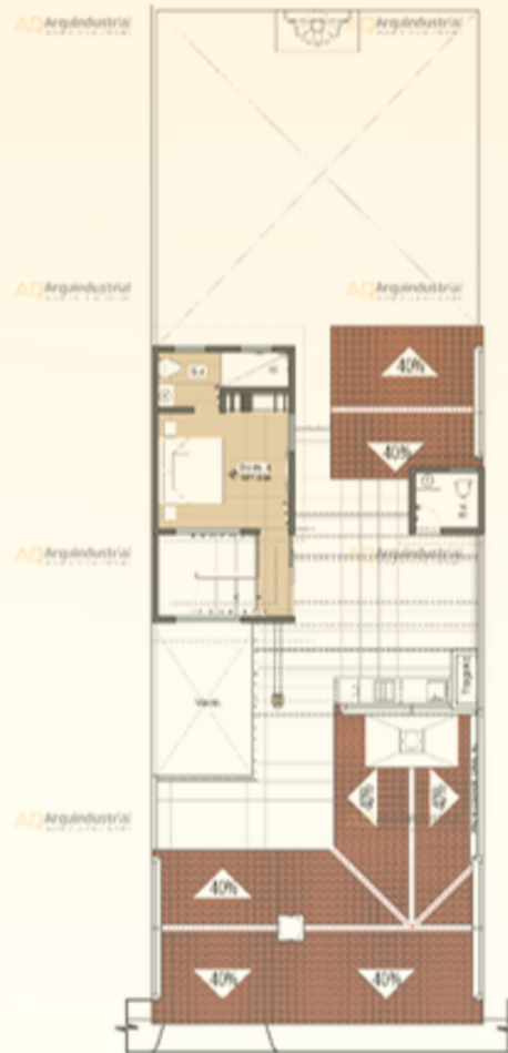
2 Planta Alta - Amoblada Casa Mariposa - Sector F - Lote 2 ESCALA 1:100